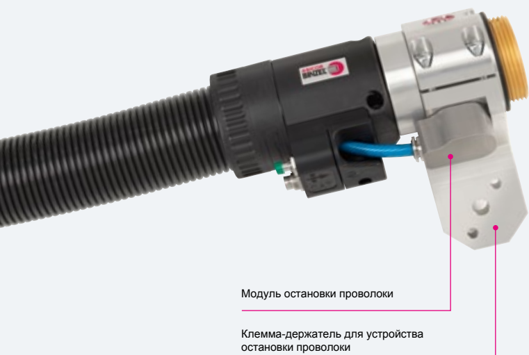
Модуль остановки проволоки