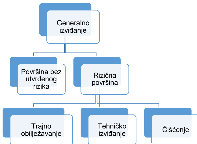
Pregled br. 1: Grafički prikaz rezultata generalnog izviđanja

GI je provjera postojećih i prikupljanje novih informacija o sumnjivim površinama na terenu bez primjene metoda deminiranja s ciljem identifikacije koje su površine rizične, a koje su površine bez utvrđenog rizika (PBUR). Prema Standardnim operativnim procedurama BHMAC-a (SOP) 17 informacije dobijene GI se unose u bazu podataka BHMAC-a na osnovu kojih se pripremaju projekti za trajno obilježavanje 18 , tehničko izviđanje (TI) 19 i čišćenje 20 . Kategorije prioriteta utvrđuju se kroz postupak GI sa evidentiranjem podataka za svaki pojedinačni predloženi projekt.