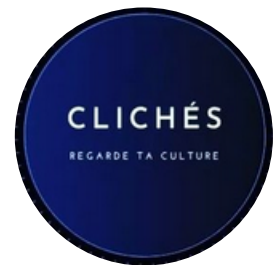
Clichés Exposition Photographie