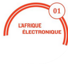
Afrique électronique Dj live et danse Musique danse