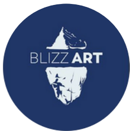
Blizz'Art Galerie virtuelle Interview musique photo

Tou.te.s les élèves ont par ailleurs déjà monté leur propres projets.