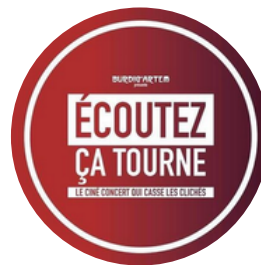
Burdig Artem Écoutez ça tourne Ciné-concert