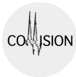
Collision Exposition photographie Photos rap skate