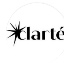
Collectif Clarté Rouge Abyssal Exposition d'art