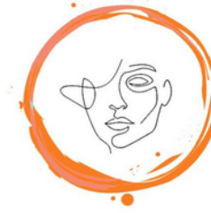
Créatives Concert en ligne Art plastique danse