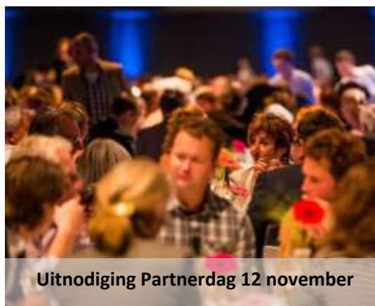
Uitnodiging Partnerdag 12 november

Als Vis&Seizoen sponsor ontvangt u jaarlijks een uitnodiging voor de Hilton Haringparty. Wie wil daar niet bij zijn?