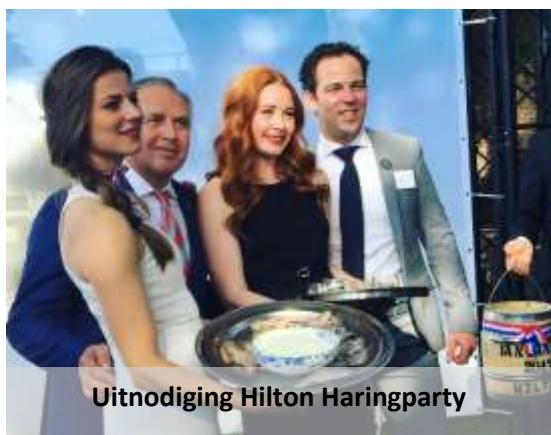
Uitnodiging Hilton Haringparty

Om Vis&Seizoen en haar doelen voor een langere periode te steunen zijn wij op zoek naar een samenwerking met een sponsor. Als sponsor van Vis&Seizoen investeert u indirect in de onderzoeken die nodig zijn om bepaalde vissoorten in het 'groen' te krijgen. Door uw steun en bijdrage komen wij weer een stap dichterbij een duurzame wereld.