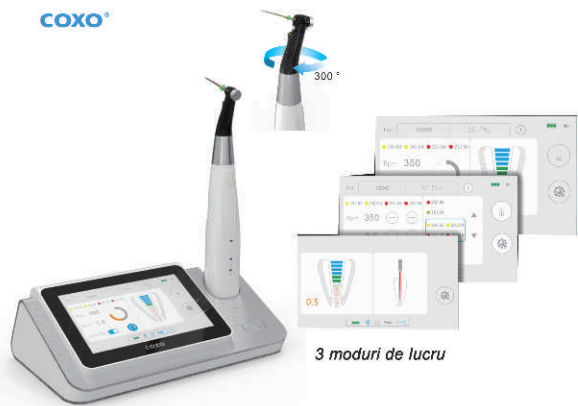
3 moduri de lucru