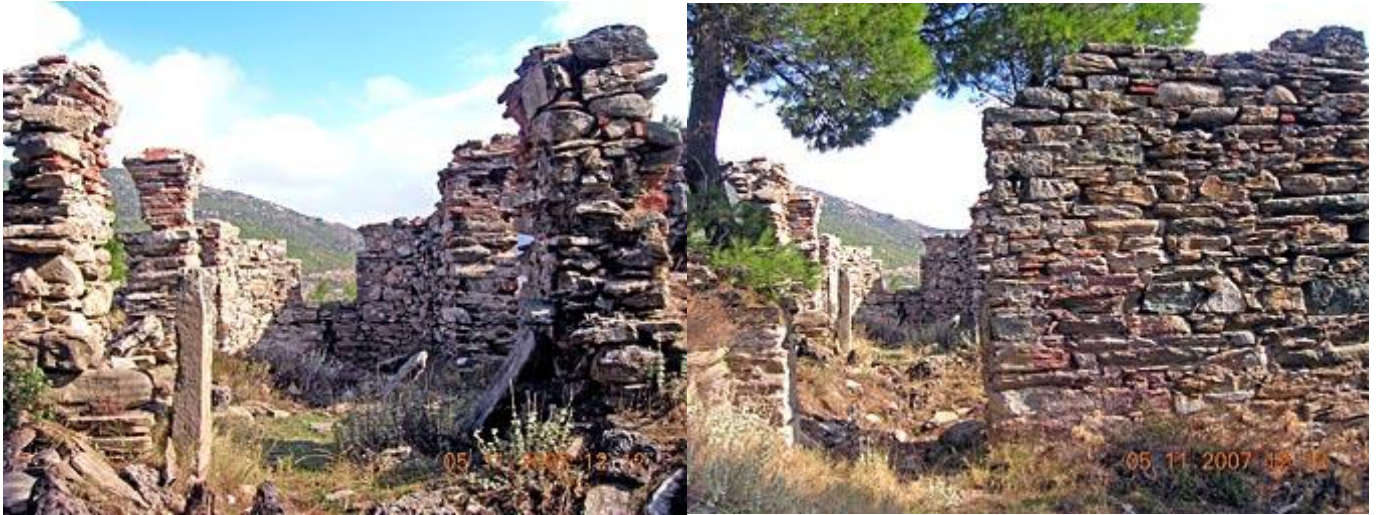
Άποψη των ερειπίων της φράγκικης εκκλησίας στο Βαγιάτι της Πεντέλης