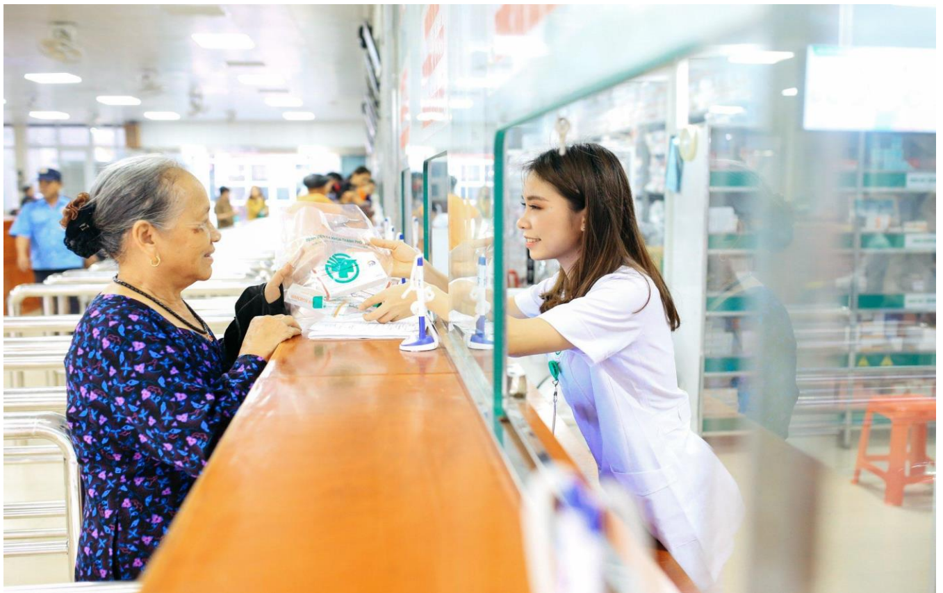
Cấp phát thuốc niềm nở, nhiệt tình.