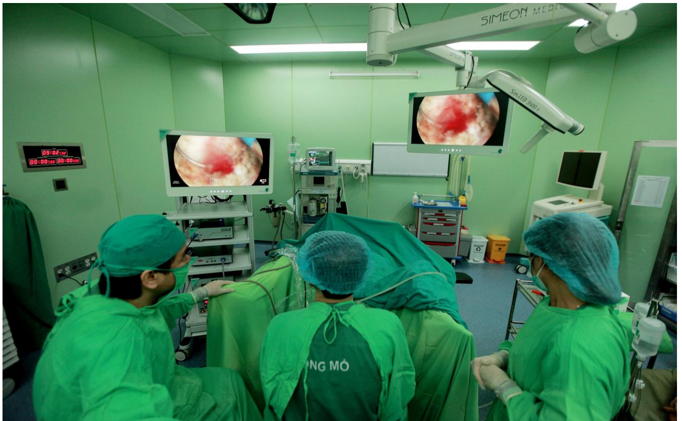
Đội ngũ bác sỹ tay nghề cao thực hiện các ca phẫu thuật phức tạp.