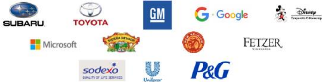
Empresas certificadas en Estados Unidos

Empresas u organizaciones públicas o privadas que quieran evidenciar su compromiso ambiental y mejorar la eficiencia de los sistemas de gestión integral de residuos por medio de la prevención de los mismos.