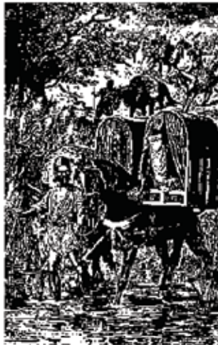
زن ایرانی به زیارت کربلا میرود

هفتم: آن بارگاهها که در مشهد و قم و عبدالعظیم و بغداد و سامره و کربلا و نجف و دیگر شهرهاست و شیعیان به زیارت روند خود جداگانه داستانیست.