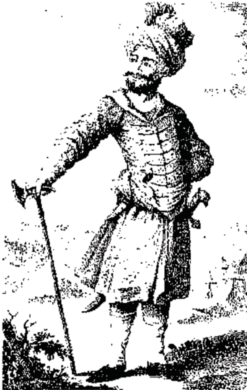
پیکره نادر قلی (تهماسب قلی خان) که در زمان خودش کشیده شده

نشاندند به گفتگو و داشت و بارها به عثمانیان فرستادگان فرستاده با این شرط پیشنهاد آشتی کرد و در دشت مغان چون پادشاهی را می پذیرفت از ایرانیان در این باره پیمان گرفت. ولی این کوششها همه بیهوده درآمد و آن پادشاه غیرتمند کشته گردیده از میان رفت. شیعیگری به حال خود مانده تا به اینجا رسید که امروز است. داستان آنرا با مشروطه نیز همگی میدانیم. اینست فهرستی از تاریخچه رواج شیعیگری در کشور ایران.