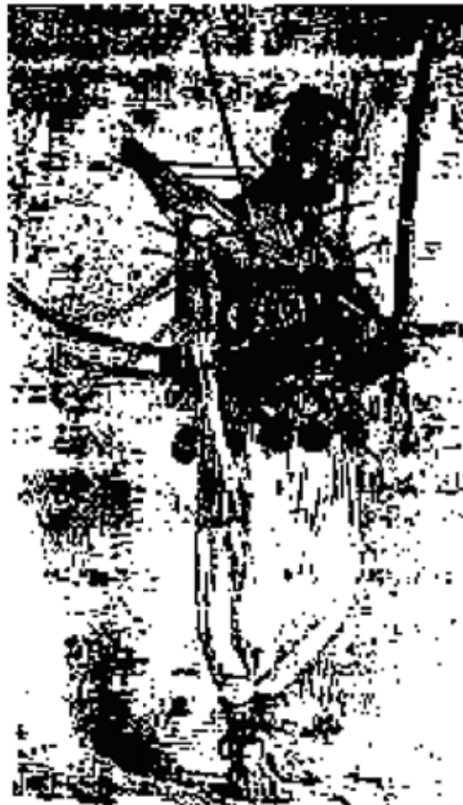
یک تن قفل به تن

اروپاییان از سالها کوشیده اند که شرقیان را در نادانیها و دژخویی هایی که میداشته اند و میدارند پایدار گردانند و از این رفتار دو نتیجه خواسته اند: یکی آنکه شرقیان در سایه همین نادانیها، ناتوان و درمانده باشند و به آسانی گردن به یوغ چیرگی آنان گزارند. دیگری اینکه بهانه در دست باشد و به «نیکخواهان جهان» که در اروپا نیز فراوانند پاسخی توانند داد.