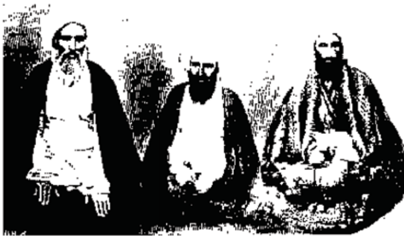
از راست بچپ: حاجی شیخ مازندرانی - حاجی تهرانی - آخوند خراسانی

با آنکه پیشوای این جنبش دو سید میبودند و سه تن از علمای بزرگ نجف که آخوند خراسانی و حاجی میرزا حسین تهرانی و حاجی شیخ مازندرانی باشند، مردانه پشتیبانها می نمودند، در میانه با ملایان نبرد سختی پدید آمد.