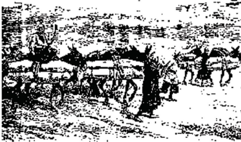
استخوانهای مردگان را بار کرده به کربلا میبرند

عثمانیان گاهی به جلوگیری پرداختنی بارها رخ داده که استخوانها را خرد کرده و در توبره اسب ریخته خواسته اند نهانی از مرز گذرانند و دانسته شده و مایه رسوایی گردیده. ۱