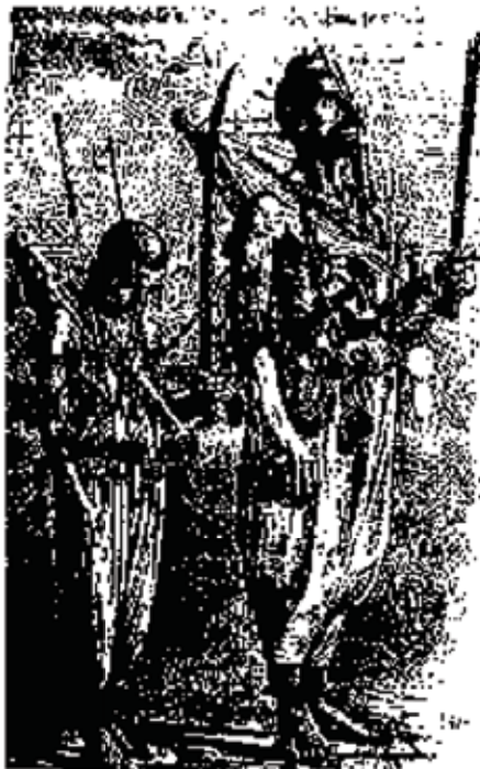
دو تن قفل به تن

روز دهم یا عاشورا «دیوانگی!» بالا رفتی. از آغاز روز صد دسته شاه حسینی راه افتادی. از هر کوی و کوچه قمه زنان با سرهای شکافته و کفهای سفید خون آلود بیرون آمدندی. مردم قره باغ در تبریز و تهران «قفل به تنان» آوردندی.