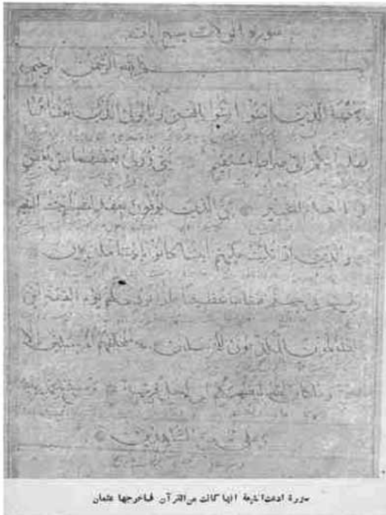
یکی از دو سوره که به قرآن افزوده اند

سیزدهم: در داستان امام ناپیدا سخن فراوانی هست و ایرادهای بسیاری توان گرفت: