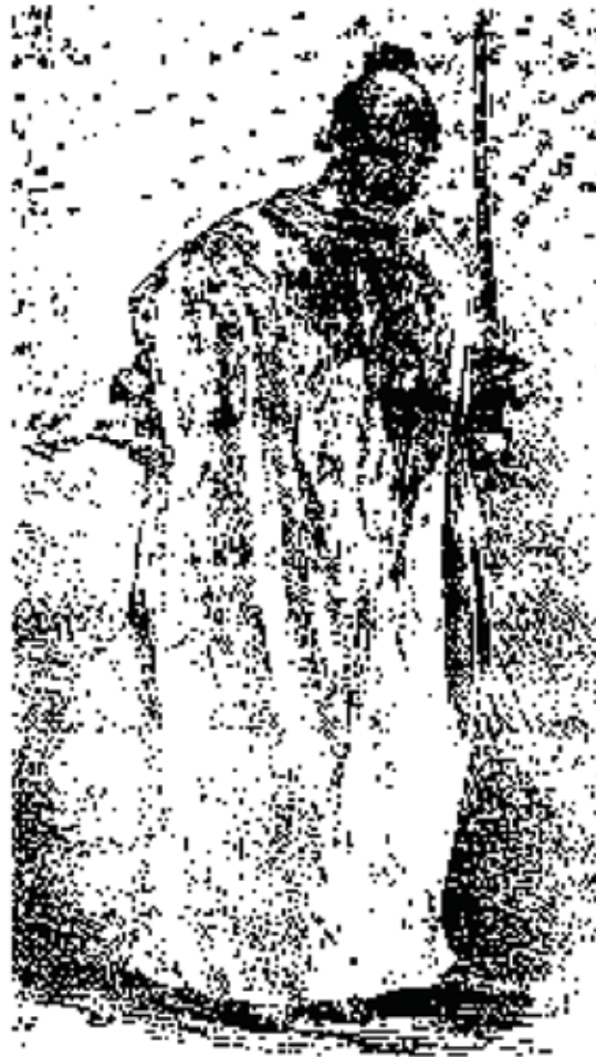
یکتن از قمه زنان

جنگها نومید شده و آتش سینه هاشان رو به خاموشی نهاده بود، و از آنسوی دولت خودکامه روس سپاه به ایران آورده و آذربایجان و دیگر شهرها را گرفته به کاستن از نیروی آزادیخواهان میکوشید، ناگهان این دفترچه به میان افتاد. ۱ تو گفتی نفت به روی آتش ریختند. ملایان و روضه خوانان و بسیاری از مردم به تکان آمده، و با آزادیخواهان که به کاستن از روضه خوانی میکوشیدند برخاش آغازیده چنین گفتند: «پس فرنگیها امام حسین را میشناسند و شما نمیشناسید، ای بیدینها؟!». این را گفته به تکان آمدند.