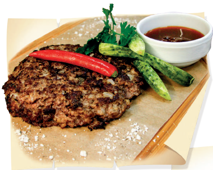
Плескавица из говядины (200/60/30 г) ..... 660 руб.

Натуральная котлета из говядины, жаренная на гриле с курдючным жиром и репчатым луком. Подается со слабосолеными огурцами и соусом «Ткемали»