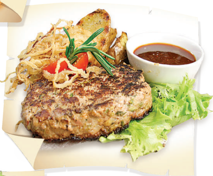
Рубленая говядина с жареным луком (200/30/30 г) ..... 660 руб.

Натуральная котлета из говядины, жаренная на гриле с курдючным жиром и репчатым луком. Подается со слабосолеными огурцами и соусом «Ткемали»