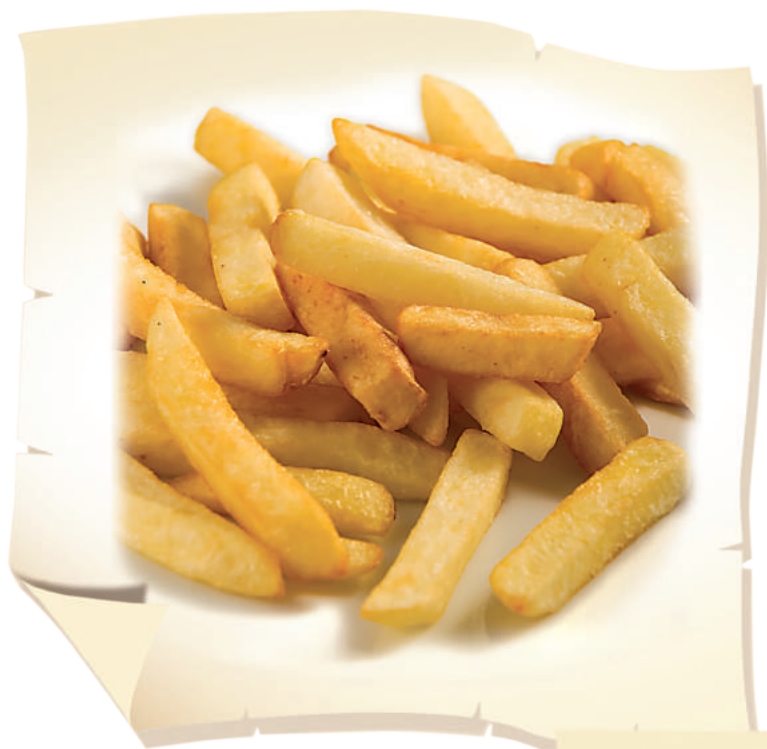
Картофель фри (150 г) ..... 220 руб.