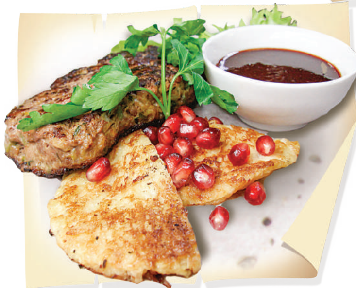
Рубленный стейк из баранины (200/30/30 г) ... 660 руб.

Мелко порубленная говяжья вырезка с беконом, подается с золотистым луком и соусом «Терияки»