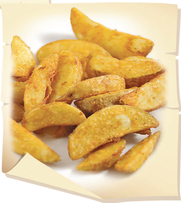
Картофель по-деревенски (150 г) ..... 220 руб.