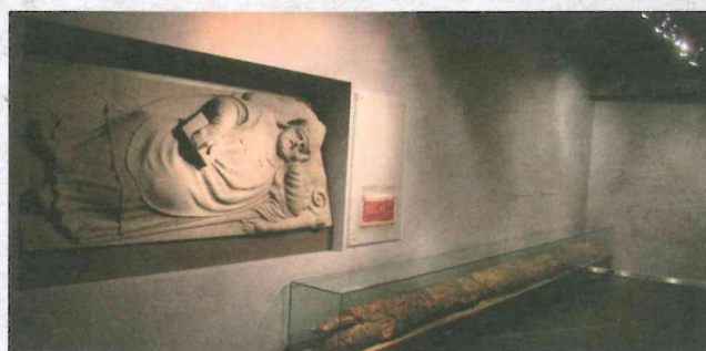
Kopia sarkofagu biskupa płockiego Andrzeja Noskowskiego z wieku