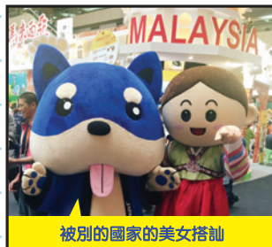
被別的國家的美女搭訕