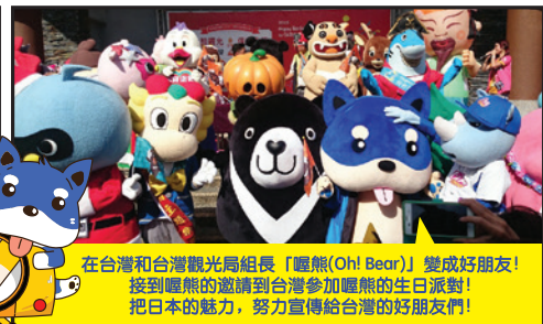
在台灣和台灣觀光局組長「嘔熊(Oh! Bear)」變成好朋友！ 接到嘔熊的邀請到台灣參加嘔熊的生日派對！ 把日本的魅力，努力宣傳給台灣的好朋友們！