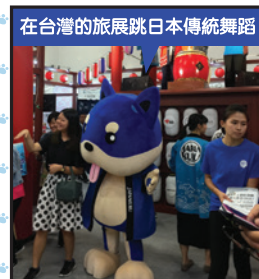
在台灣的旅展跳日本傳統舞蹈