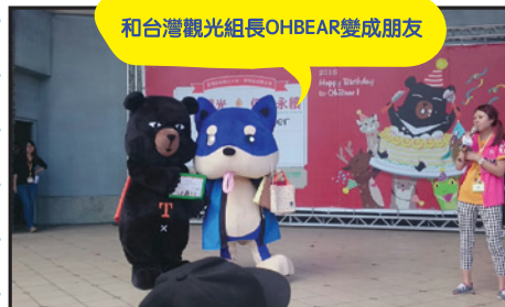
和台灣觀光組長OHBEAR變成朋友