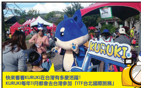
快來看看KURUKI在台灣有多活躍！ KURUKI每年11月都會去台灣參加【ITF台北國際旅展】