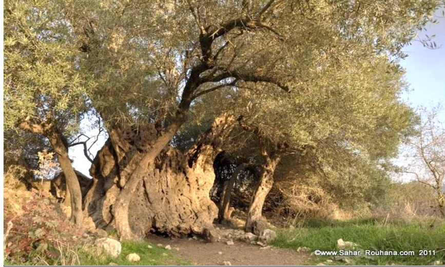
ما تبقى من شجر الزيتون في قرية صوبا