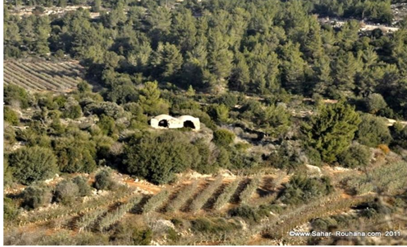
مقام الشيخ إبراهيم الأدهمي

٤- صُلاح الباب: ويقع في مدخل القرية قرب بوابة البلد، وهو عبارة عن غرفة صغيرة له باب صغير، وكان يضاء بقناديل الزيت كل ليلة جمعة وفي المناسبات الدينية المختلفة. "١٦"