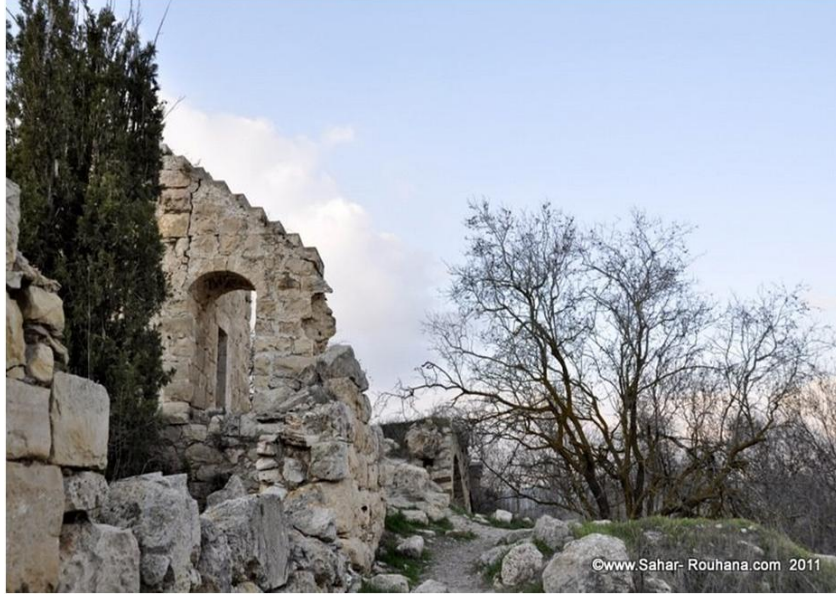
بقايا قلعة صوبا المدمرة