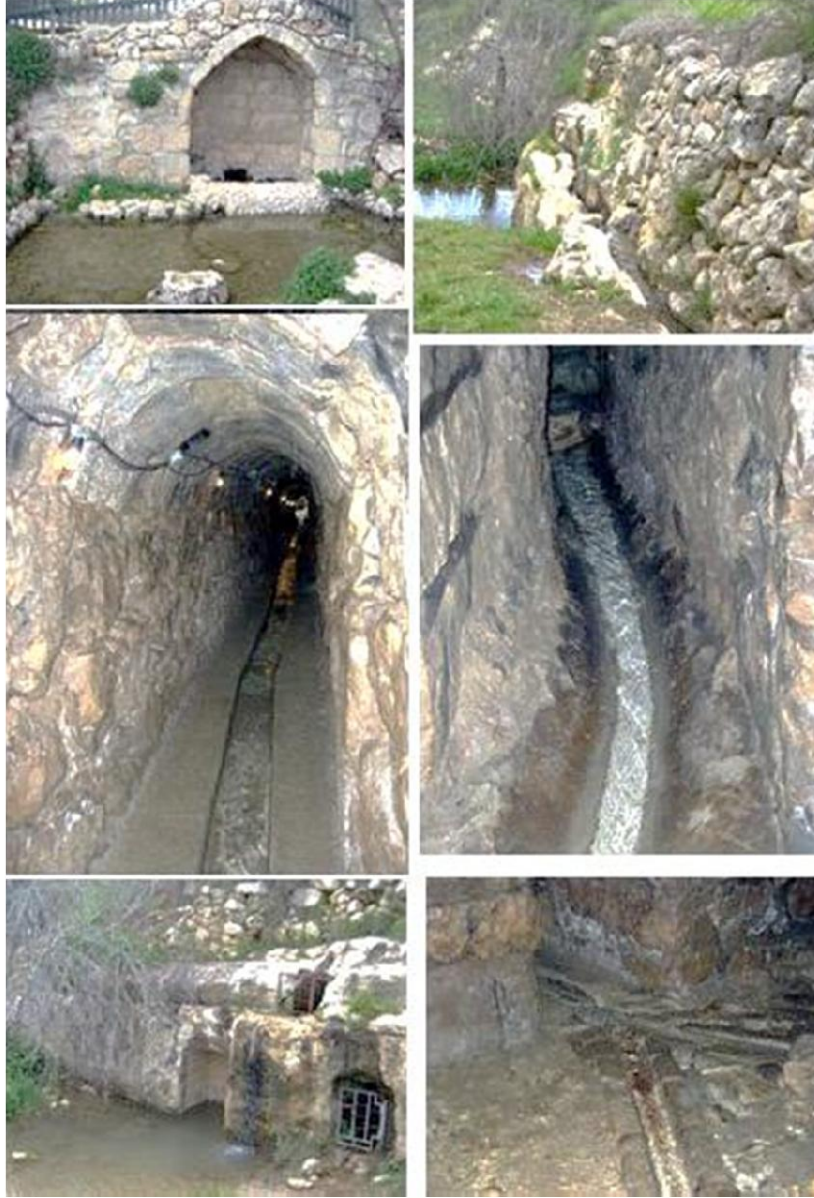
عين صوبا - صور للذبعة ومجمع الماء