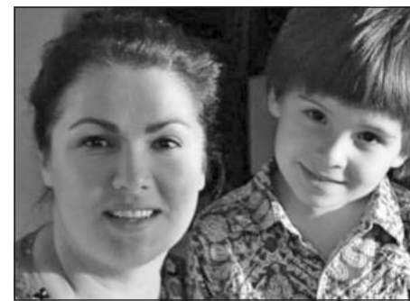
Певица с сыном

Его отцом был уругвайский оперный баритон Эрвин Шротт. Их отношения продолжались около 6 лет, в 2013 г. стало известно о том, что артисты расстались. О причинах Анна позже говорила: «Любовь была, но очень большую роль сыграло различие в культурах. Мы говорили на разных языках. Не могли объяснить друг другу, что чувствуем».