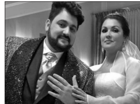
Анна Нетребко и Юсиф Эйвазов