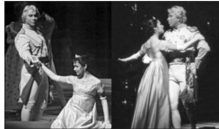
Анна Нетребко и Дмитрий Hvorostovsky в опере «Война и мир»

объездила с гастрольями множество стран, исполнила главные партии практически во всех классических оперных постановках, выступила в лучших концертных залах всего мира. В начале «нулевых» вышел первый студийный альбом с оперными партиями в исполнении Анны Нетребко.