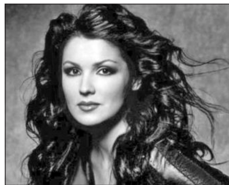
Народная артистка России Анна Нетребко

Ее профессиональная судьба складывалась очень успешно, а вот в личных отношениях долгое время преследовали неудачи. Ее жизнью была сцена, в юности она была целиком сосредоточена на своей карьере, и времени для романов у нее попросту не оставалось. Первые серьезные отношения случились у певицы только в 22 года. Все ее избранники тоже были артистами из разных стран и вели такой же кочевой гастрольный образ жизни, из-за чего построить крепкую семью с ними не удавалось.