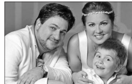
Певица с сыном и мужем