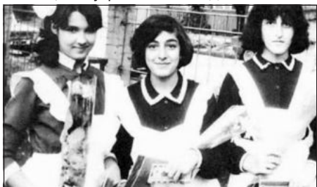
Певица в школьные годы

Анна Нетребко выросла в Краснодаре, в семье геолога и инженера-связистки. По отцовской линии в ее роду были запорожские казаки. Кроме того, у нее есть и цыганские корни. Наверное, такому смешению кровей Анна обязана и своей эффектной внешностью, и волевым характером, и неумной энергией, и особенной статью, и внутренней свободой.