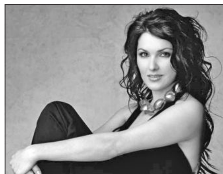
Народная артистка России Анна Нетребко

Уже через несколько месяцев Нетребко стала настолько востребованной артисткой, что из-за своей занятости в театре не смогла окончить консерваторию и получить диплом. С тех пор ее график был расписан на месяцы вперед, а после того как она выступила в Сан-Франциско в постановке «Руслан и Людмила», получила приглашение на трехмесячную стажировку в США.