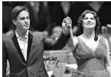
Анна Нетребко и Эрвин Шротт

Ее профессиональная судьба складывалась очень успешно, а вот в личных отношениях долгое время преследовали неудачи. Ее жизнью была сцена, в юности она была целиком сосредоточена на своей карьере, и времени для романов у нее попросту не оставалось. Первые серьезные отношения случились у певицы только в 22 года. Все ее избранники тоже были артистами из разных стран и вели такой же кочевой гастрольный образ жизни, из-за чего построить крепкую семью с ними не удавалось.