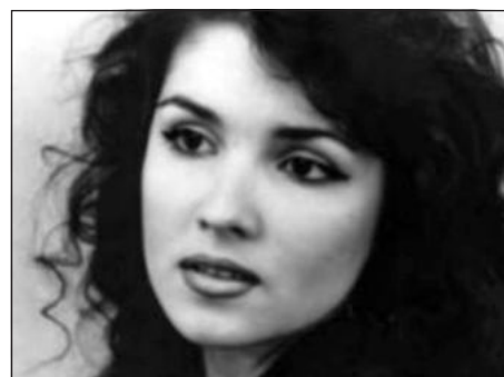
Анна Нетребко в молодости

Ее педагоги отмечали не только ее талант, но и удивительную для юной девушки работоспособность и целеустремленность. На первом курсе она устроилась в Мариинский театр уборщицей и на протяжении двух лет мыла полы ради возможности смотреть все спектакли и быть хоть на шаг ближе к своей мечте. На четвертом курсе Анна стала лауреатом премии им. М. Глинки, а вскоре ее пригласили в Мариинский театр уже в качестве певицы.