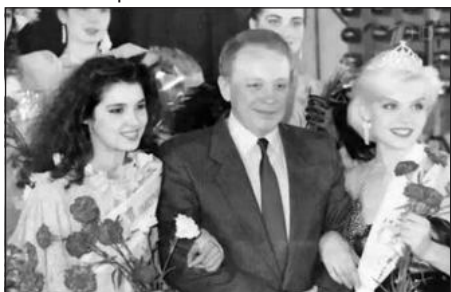
Анна Нетребко на конкурсе красоты «Мисс Кубань-88»

Хотя в семье Нетребко никто профессионально не занимался искусством, отец отлично пел и играл на фортепиано, и свою музыкальность младшая дочь унаследовала от него. Еще в раннем детстве она устраивала домашние концерты, а в школьные годы начала выступать в качестве солистки ансамбля «Кубанская пионерия». Кроме того, в юности Анна занималась спортивной гимнастикой, у нее были разряды по легкой атлетике и звание кандидата в мастера спорта по акробатике. А в старших классах Анна приняла участие в конкурсе красоты «Мисс Кубань» и заняла второе место.