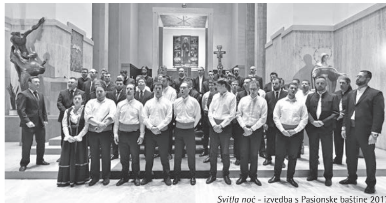
Svitla noć - izvedba s Pasionske baštine 2017.

Poslušajte braćo mila (Zaton, obr: J. Čaleta)