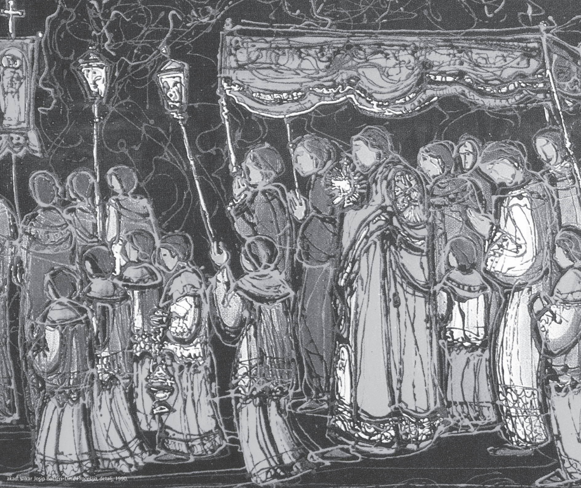
akad. slikar Josip Botteri-Dini, Procesija , detalj, 1990.