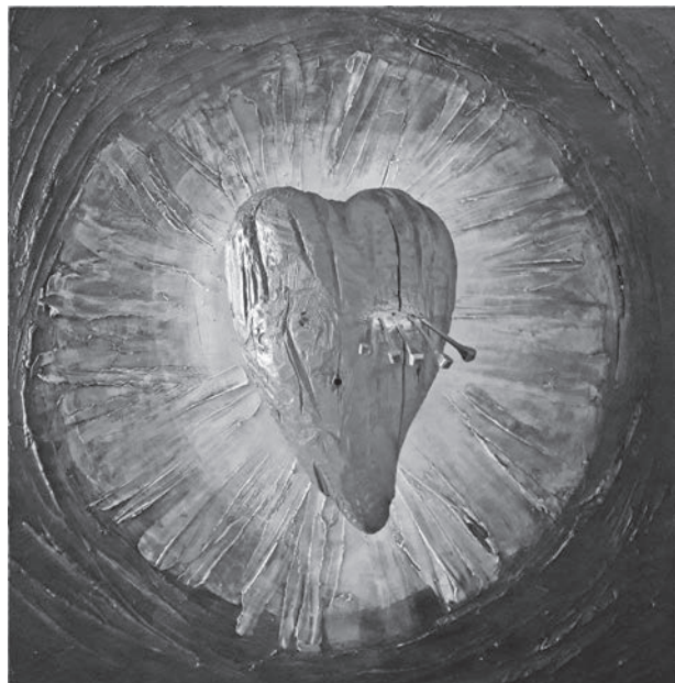
Karin Grenc, Božanska ljubav , drvo, akril, metalni klinovi