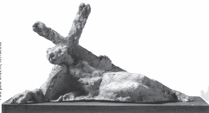
Pod pod križem, terracota

odabir i postav: Stanko Špoljarić, Stjepan Pepeljnjak