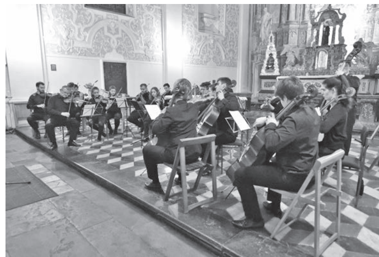
Komorni orkestar Muzičke akademije Zagreb, Pasijska baština 2017.

Orkestar redovito svake godine održava po nekoliko koncerta, isprva u dvorani Akademije (F-5) a od nedavno u novoj zgradi Muzičke Akademije u Dvorani B. Berse, zatim redovito nastupa na Memorijalu J. Š. Slavenski u Čakovcu (od 2008.) kao i u Zagrebu u sklopu manifestacije Pasijska baština. Nastupio je u sklopu Glazbenog ciklusa Mladi glazbenici u Matici hrvatskoj u Zagrebu, a u nekoliko prigoda i u dvorani Hrvatskog glazbenog zavoda. Gostovao je u tri navrata u Beču-dva puta u Peterkirche (2011. pod umjetničkim vodstvom Catherine Mackintosh i opet u studenom 2017. s dirigentom i skladateljem Zoranom Novačićem), te koncert u Universität für Musick und darstellende Kunst (2013) pod vodstvom prof. J. Haluza. Nastupio je i u Poreču u sklopu godišnjeg skupa europske udruge gudačkih pedagoga (ESTA 2012.), kao i u Puli na Danima Akademije (2017.).