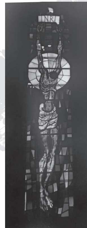
Ivo Dulčić, Krist na križu , vitraj