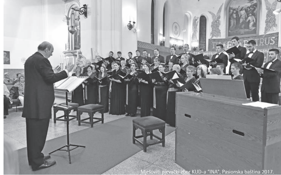
Mješoviti pjevački zbor KUD-a "INA", Pasionska baština 2017.