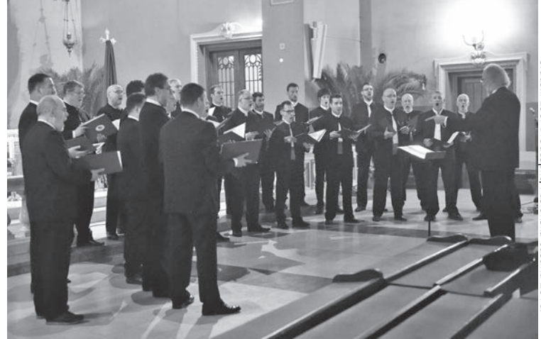
Gradski zbor Brodosplit, Pasiionska baština 2016.

Gradski zbor Brodosplit osnovan je 1972. godine. Svojim radom, brojem nastupa, zanimljivošću programa, vrijednošću interpretacije, kulturom pjevanja, osebujnom zvučnošću i kompaktnošću glasova, postao je jedan od najcjenjenijih zborova u Hrvatskoj.