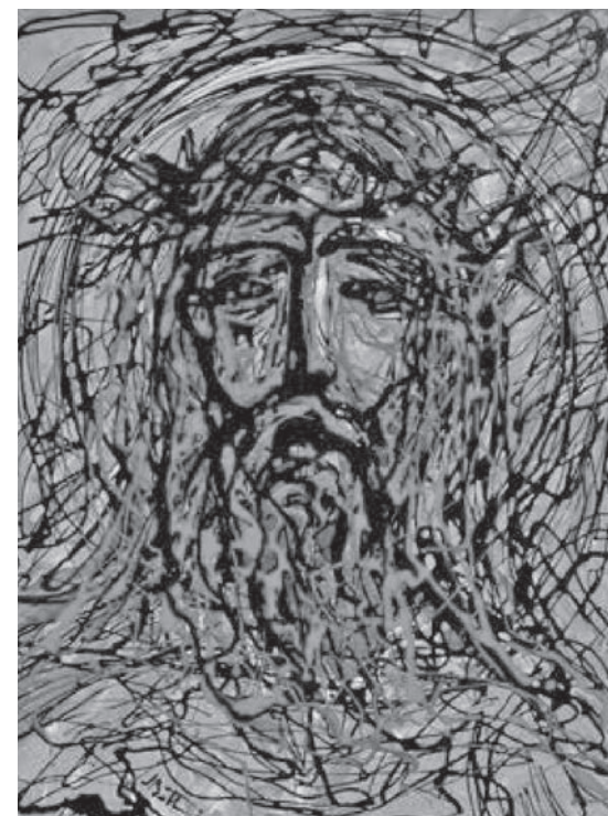
Josip Botteri Dini, Ecce Homo , 2016., akrilik na platnu