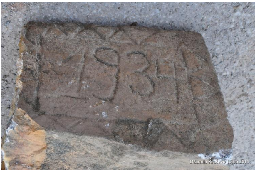
Kamena ploča nađena u temelju džamije uništene u poplavi 1979. godine

Ramadan Haruni prenosi da njegov otac Sejfudin, rođen 1907. godine, nije zapamtio džamiju u Gornjoj mahali, što znači da natpis iz 1934. označava renoviranje džamije na postojećem mjestu, a da je stara džamija u Gornjoj mahali poplavljena prije 19. vijeka. Na tom mjestu su do devedesetih godina prošloga vijeka postojali nadgrobni nišani, ali su nemarkom mještana uništeni.