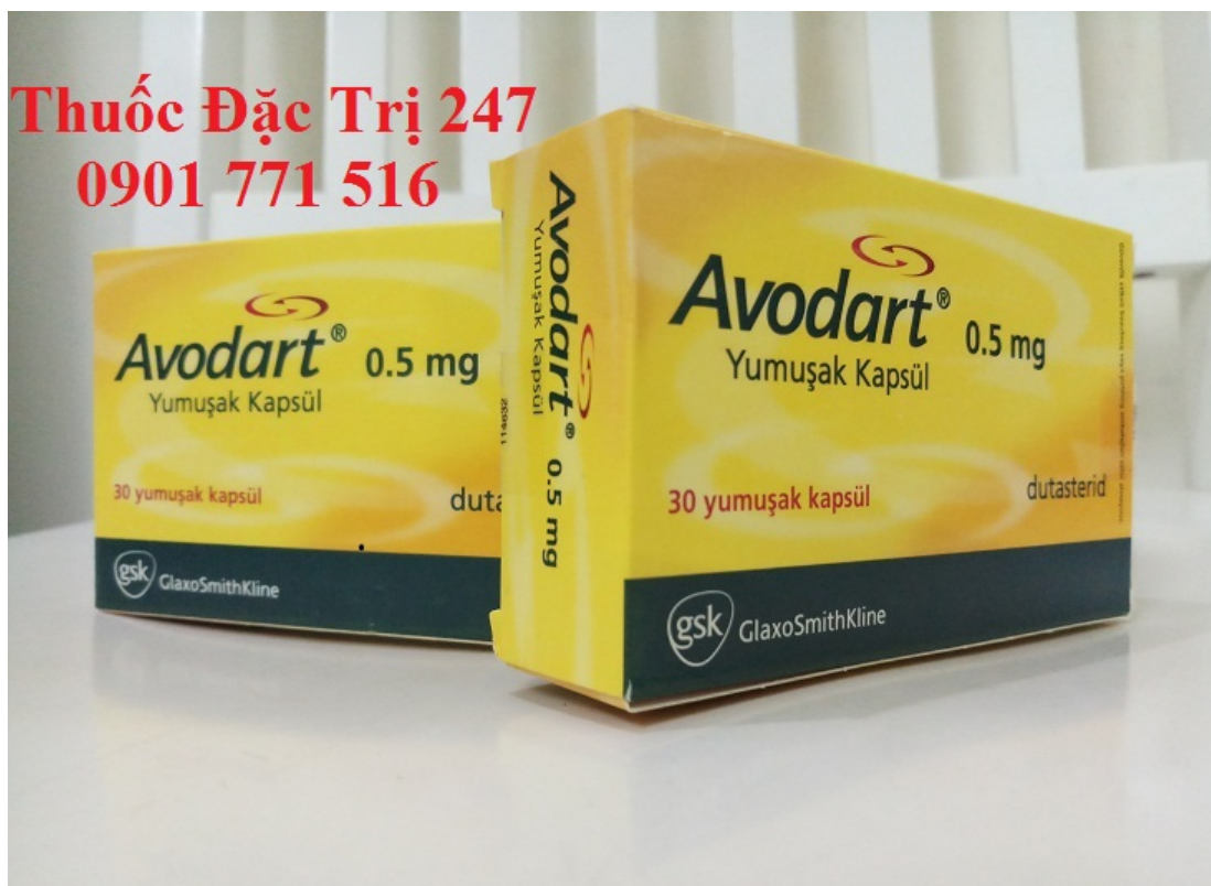
Thuốc Avodart 0.5mg Dutasteride điều trị và phòng ngừa phình đại tuyến tiền liệt – Thuốc đặc trị 247 (1)