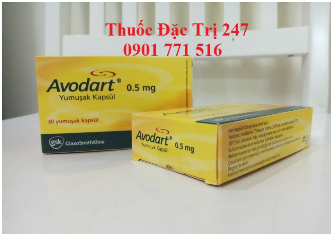
Thuốc Avodart 0.5mg Dutasteride điều trị và phòng ngừa phình đại tuyến tiền liệt – Thuốc đặc trị 247 (2)