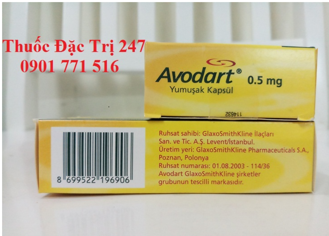
Thuốc Avodart 0.5mg Dutasteride điều trị và phòng ngừa phình đại tuyến tiền liệt – Thuốc đặc trị 247 (3)

Không phải tất cả các kích cỡ gói có thể được bán trên thị trường.