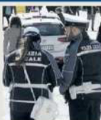
Agenti della polizia locale a Perugia