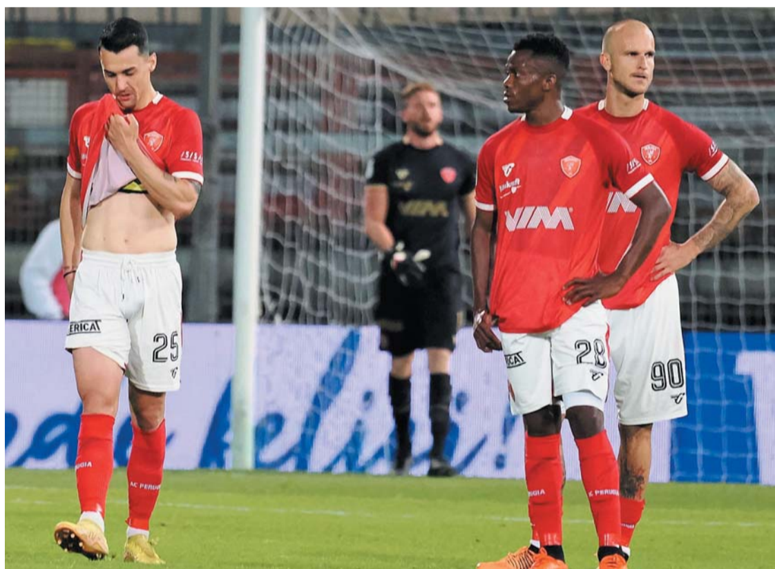
Retrocessione più vicina Grifo giù 5-0 al Curi: per la salvezza serve un miracolo → Nell'insero Carlo Forciniti

Gioia dei tifosi azzurri in molte piazze