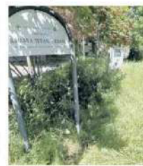
Erba alta a Terni

TERNI La città cuore verde d'Italia. Mai slogan è più calzante di questo a giudicare dall'erba che cresce rigogliosa. Sarà che in primavera c'è il risveglio della natura, sarà che con le prime piogge anche un ciuffetto diventa un cespuglio, sta di fatto che dal centro alla periferia sono molte le zone che hanno assunto le sembianze di una giungla. La situazione diventa pesante e mette a dura prova la pazienza dei cittadini. E i genitori protestano per il rischio cinghiali. Di Lecce a pag. 42