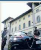
Sono intervenuti i carabinieri

Stalker distrugge auto alla moglie, arrestato