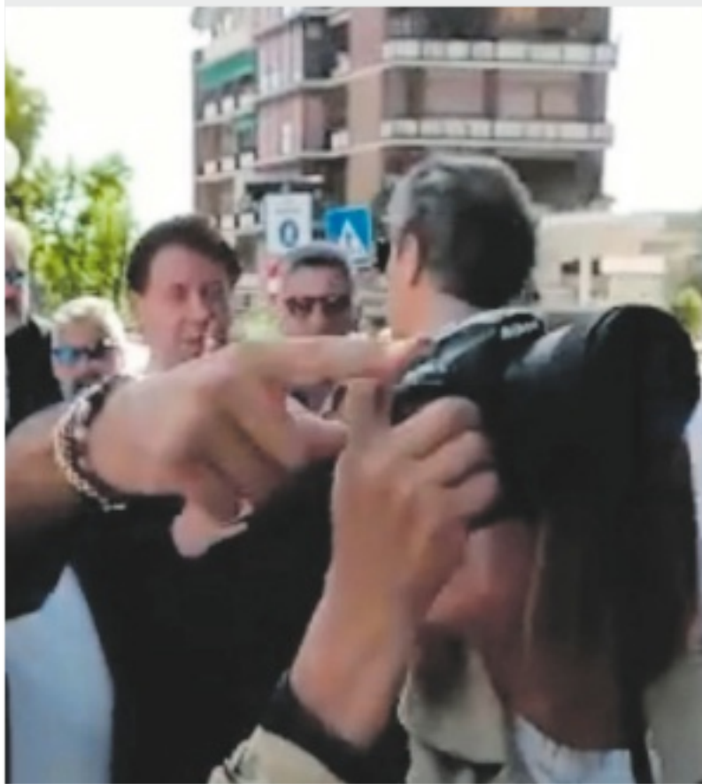
VIOLENZA Giuseppe Conte affrontato dall'esponente No Vax a Massa