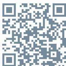
ТОРГОВЫЙ КАТАЛОГ HELLA