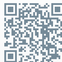
HELLA PAGID BRAKE SYSTEMS