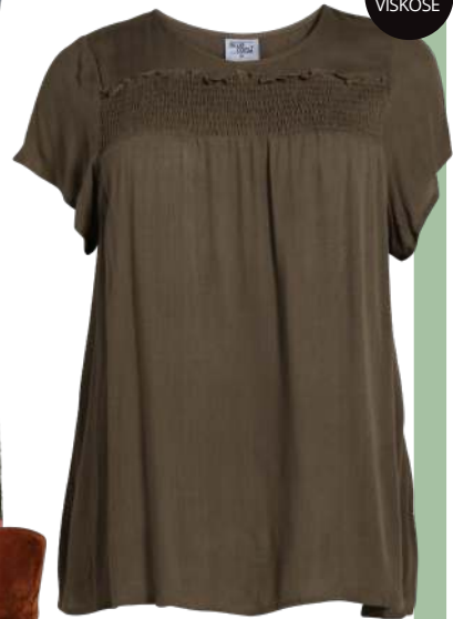
BLUSE MITA 400,-