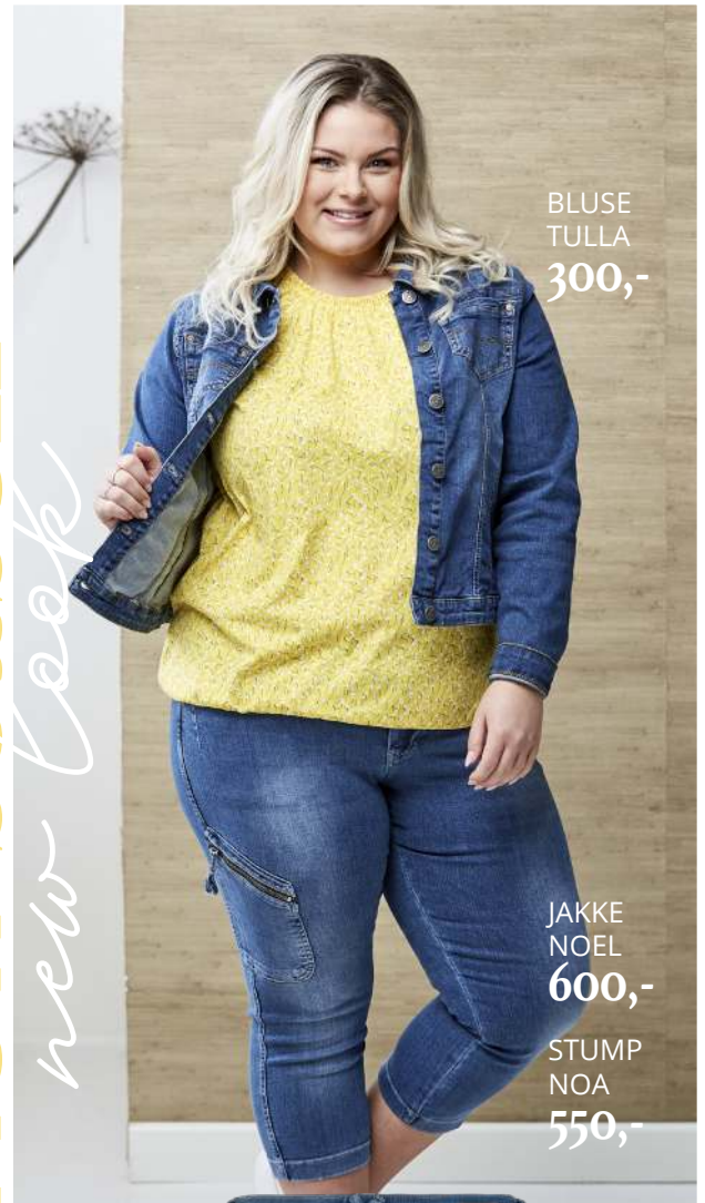
BLUSE TULLA 300,-