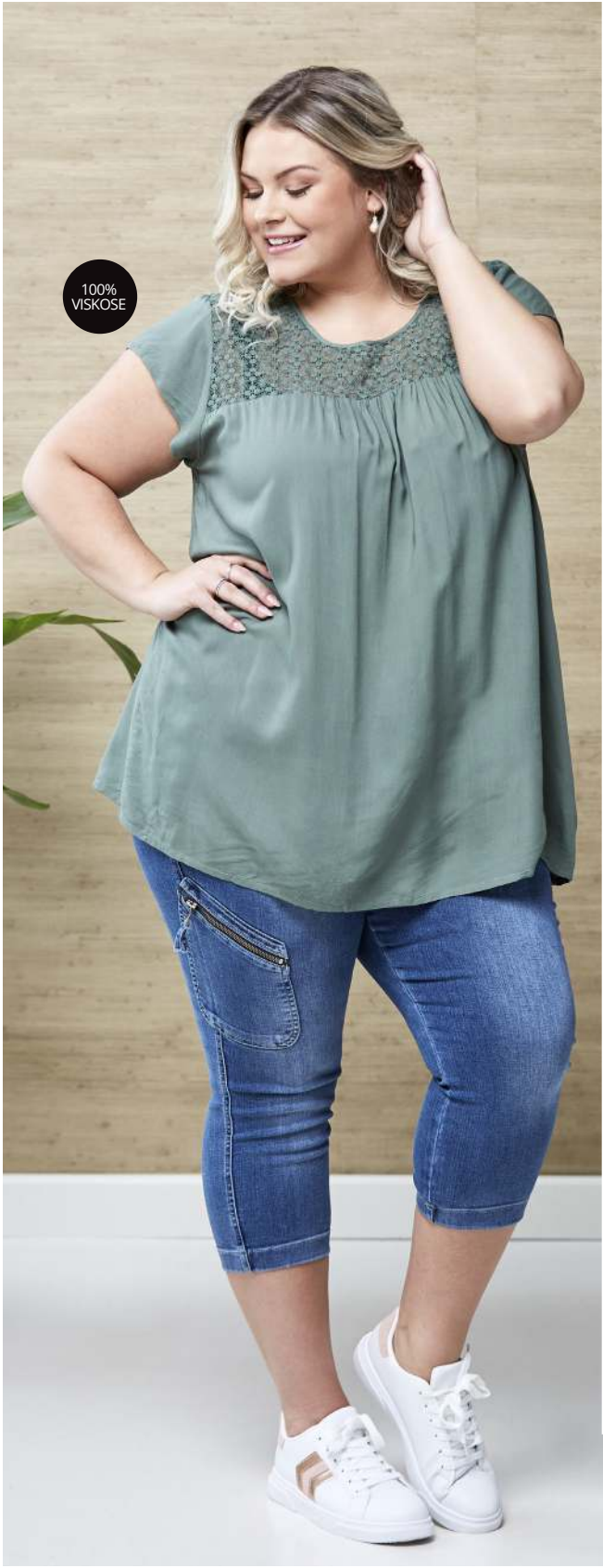
BLUSE - DAISY - ARMY, SORT, KORAL - 400,- STUMPEBUKSER - NOMA 8 - 550,-