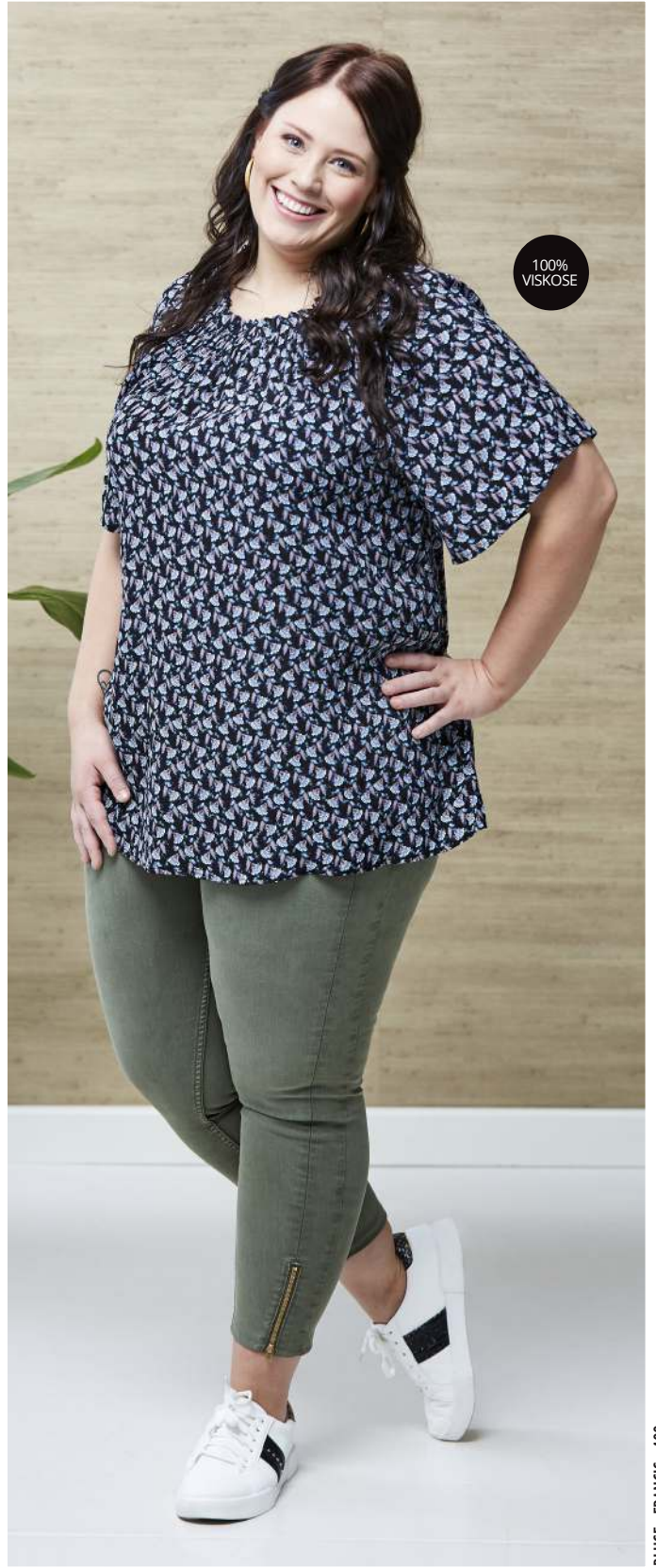
BLUSE - FRANCIS - 400,- 7/8 DEL BUKS - NIAS - 600,-