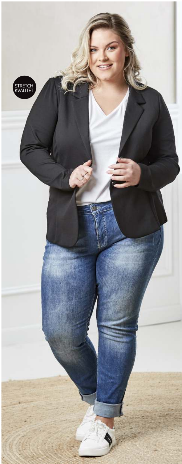
BLAZER · FAUNIS · 650,- JEANS · NAYA A · 600,-