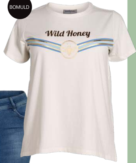
T-SHIRT FREJA 280,-