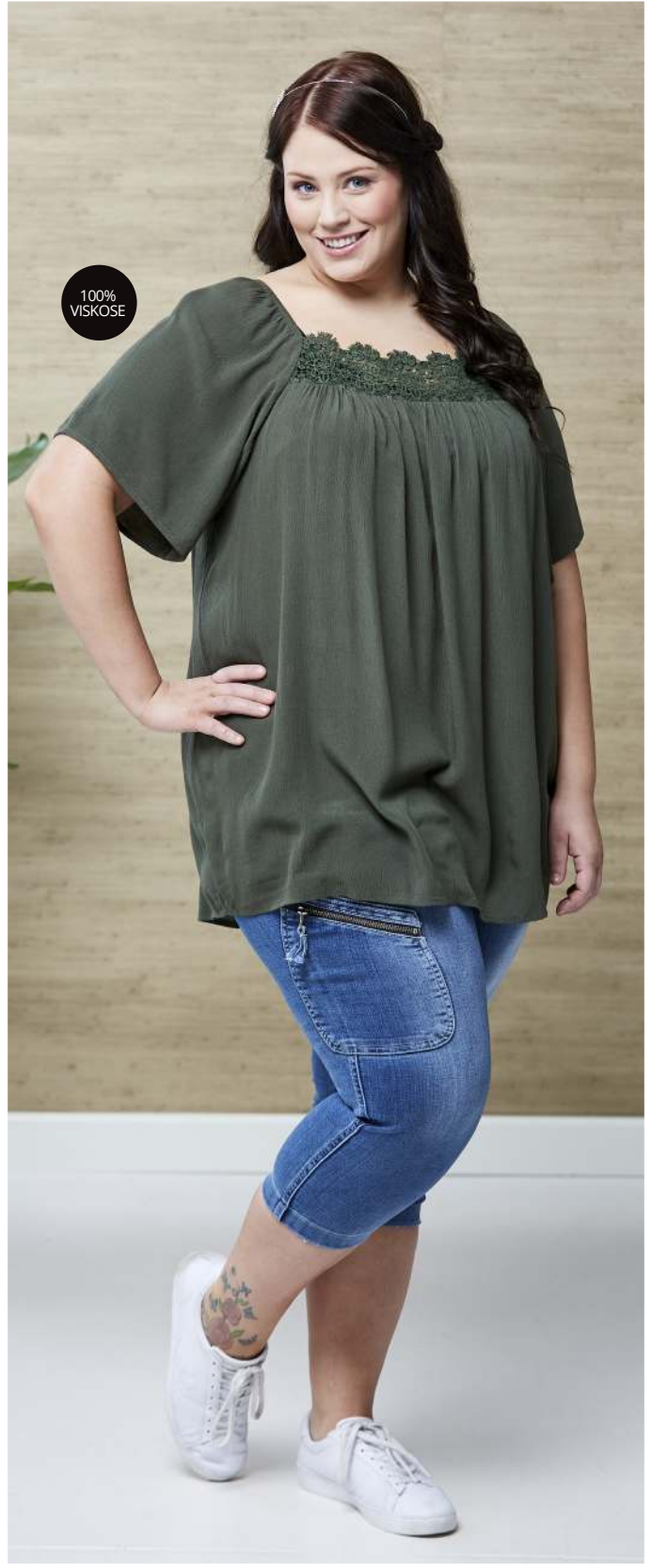
BLUSE · DOME · 400,- STUMPEBUKS · NOA · 550,-