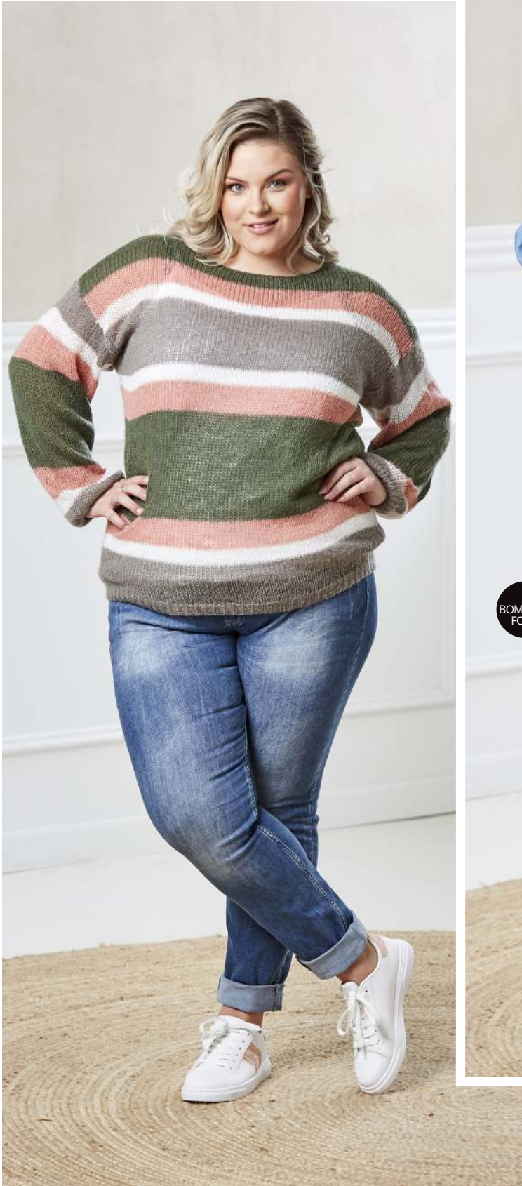
STRIK · NOVA · BLÅ, GRØN · 350,- JEANS · NAYA A · 600,-