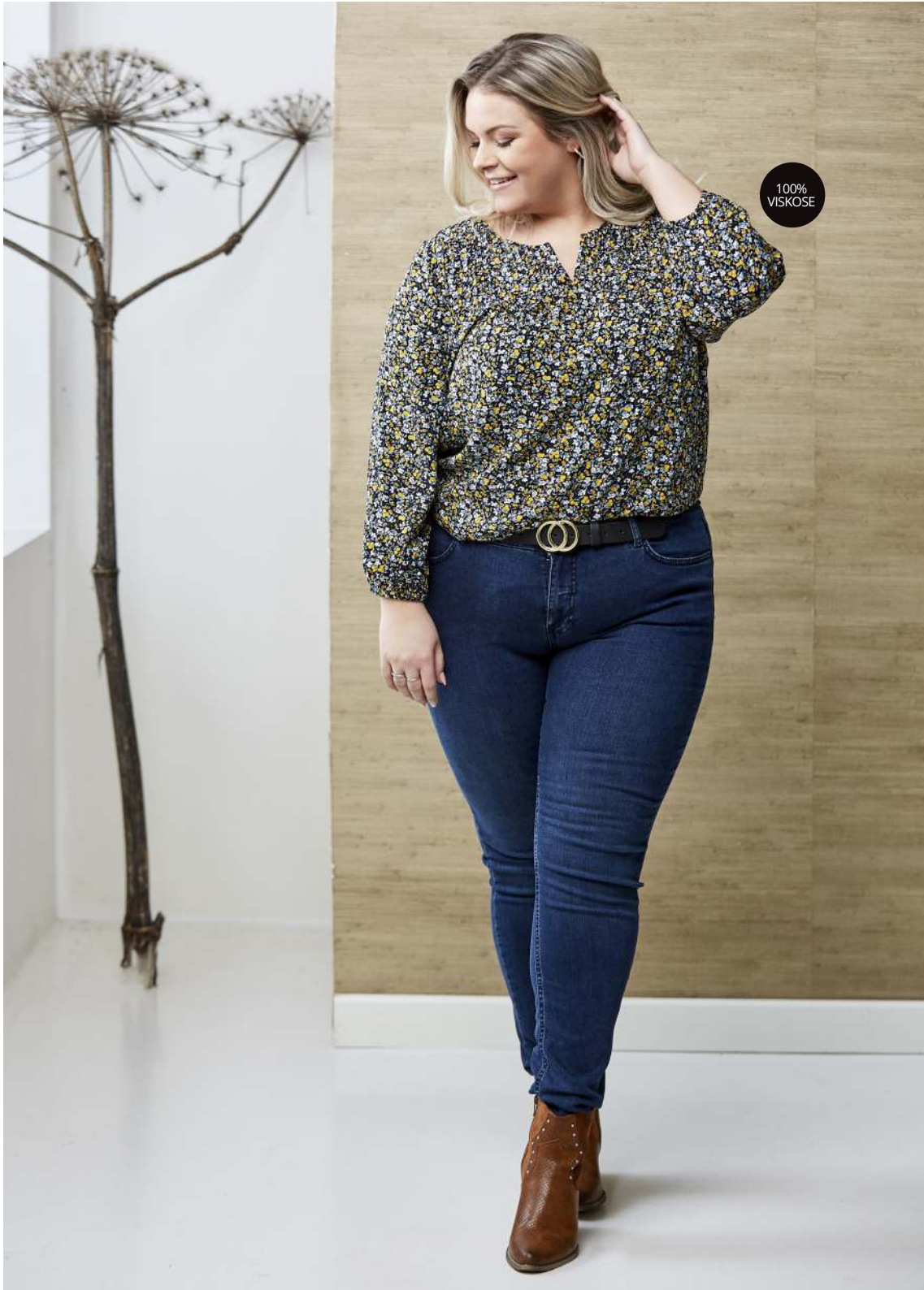
BLUSE - FIFI - 400,- JEANS - NOORA - SORT, DARK - 400,-