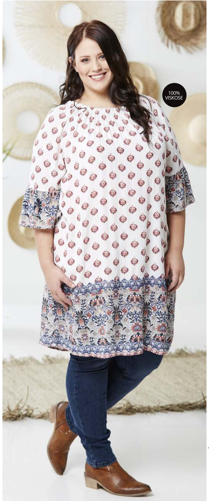
TUNIKA - DUMA - HVID, BLÅ - 400,- JEANS - NOORA - SORT, DARK - 400,-