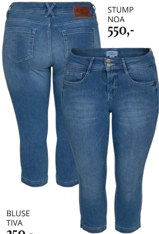
STUMP NOA 550,-