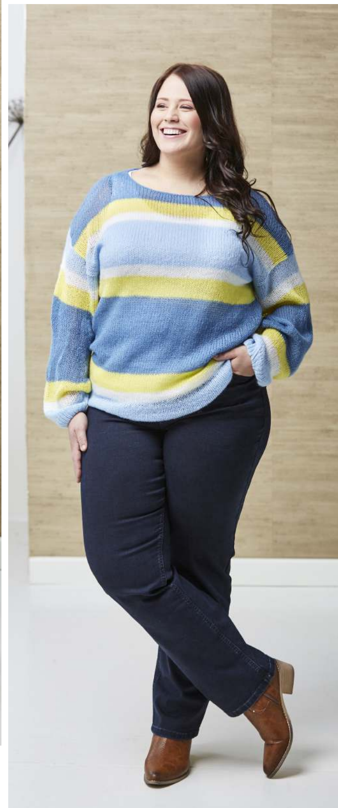
STRIK - NOVA - 350,- JEANS - NAYA DARK - 600,-