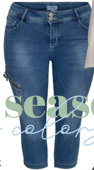
STUMP NIAS 400,-