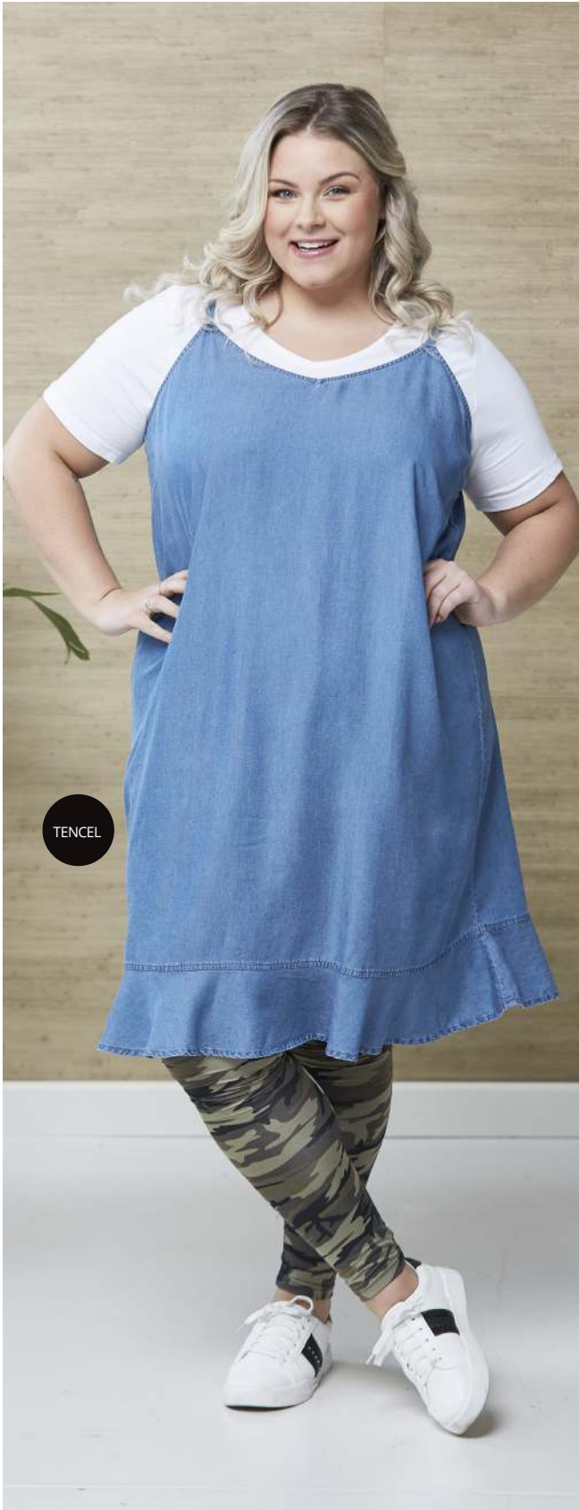
KIOLE · MALA · 450,- LEGGING · ZHENZI · 2501973 · 200,-