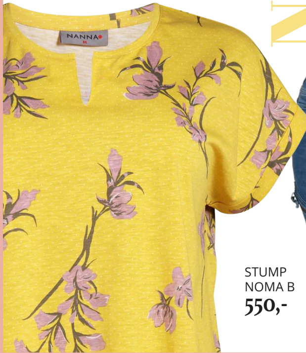
STUMP NOMA B 550,-