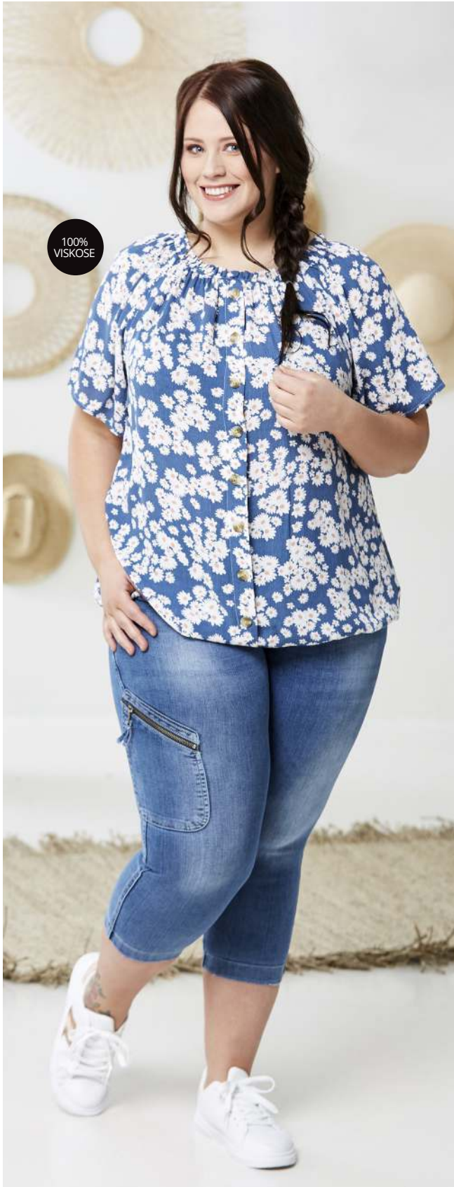
BLUSE - LENA - BLÅ, KORAL - 300,- STUMPEBUKS - NOA - 550,-