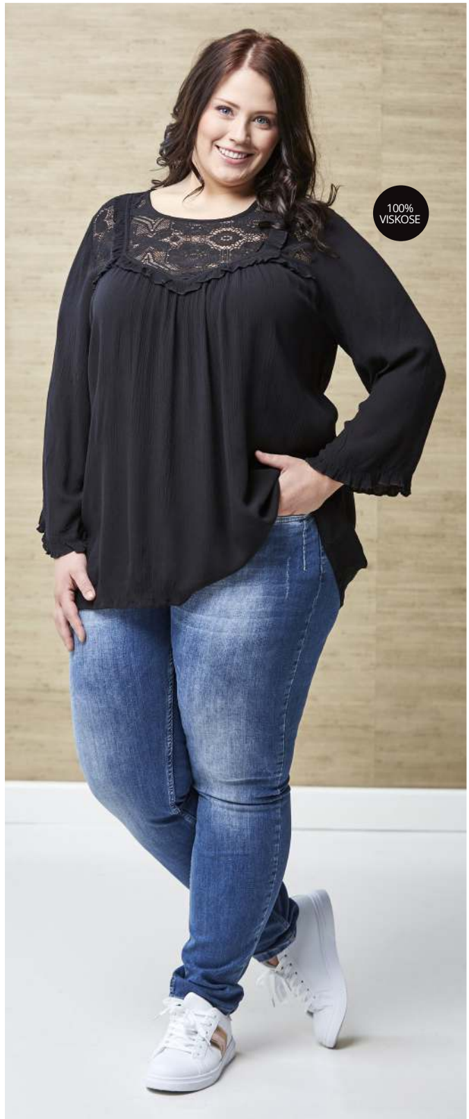
BLUSE · DAQA · 400,- JEANS · NAYA A · 600,-