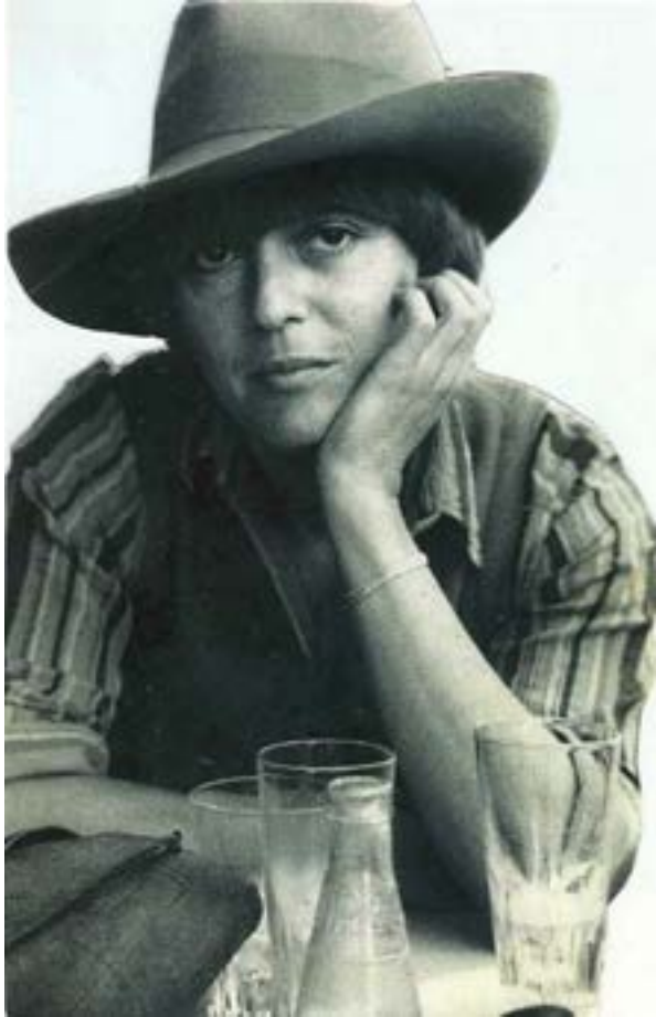
Monique Wittig (Escritora francesa y teórica feminista)