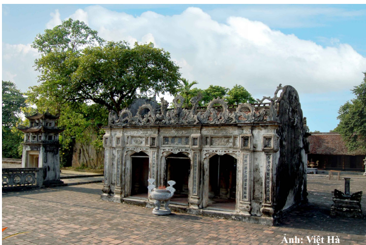
Đền thờ Đức Thánh Nguyễn tại xã Gia Thắng và Gia Tiên, huyện Gia Viễn

N inh Bình là vùng đất hội tụ đầy đủ các yếu tố để trở thành điểm đến linh thiêng, hấp dẫn trong mỗi cuộc hành hương. Bạn bè trong và ngoài nước biết đến Ninh Bình không chỉ với những cảnh đẹp nên thơ, hùng vĩ mà còn qua các di tích lịch sử văn hóa, các lễ hội truyền thống đậm chất dân gian của vùng “Cổ đô đá”. Cảnh quan thiên nhiên kỳ diệu và các di tích lịch sử văn hóa có giá trị là điều kiện thuận lợi để Ninh Bình phát triển du lịch sinh thái, du lịch tâm linh. Đặc biệt, vùng đất Ninh Bình là nơi phát tích thiêng, từ Phủ Tràng An - nơi sinh Vương, sinh Thánh. Dân gian có câu: