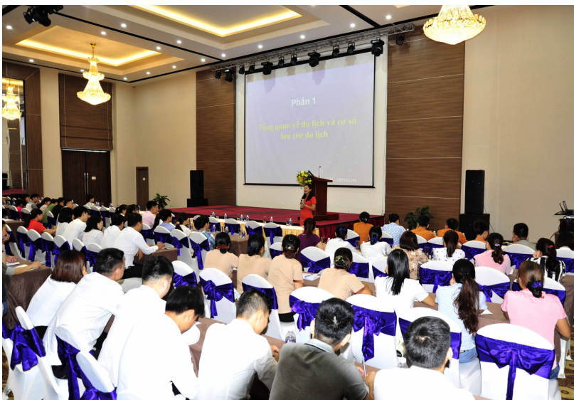
Tổ chức tập huấn cho cán bộ và nhân viên làm tại các khu, điểm du lịch

và ứng dụng du lịch thông minh trên thiết bị di động”; phối hợp với Ban Tuyên giáo Tỉnh ủy, Sở Thông tin và Truyền thông cung cấp, cập nhật thông tin về công tác chuẩn bị Năm Du lịch quốc gia 2020 - Ninh Bình cho các cơ quan thông tấn, báo chí trung ương và địa phương; Tổ chức các lớp tập huấn, bồi dưỡng kiến thức du lịch cộng đồng,