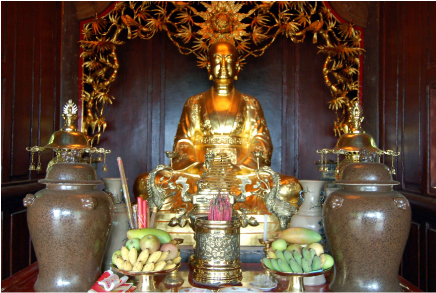
Tượng Đức Thánh Nguyễn thờ tại chùa Bái Đính cổ

hai làng liền kề nhau thuộc huyện Gia Viễn, tỉnh Ninh Bình đồng thời cũng là những người con tiêu biểu của vùng đất này. Đinh Tiên Hoàng Đế là vị vua mở nền chính thống cho các triều đại phong kiến trong lịch sử và Thiền sư Nguyễn Minh Không là vị Thánh được tôn sùng trong lòng nhiều người dân Việt.