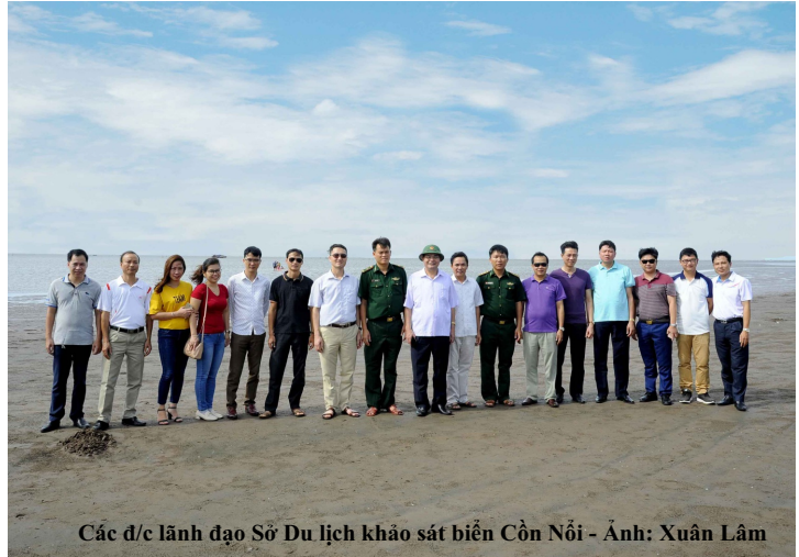
Các đ/c lãnh đạo Sở Du lịch khảo sát biển Cồn Nổi

Thực hiện Kế hoạch số 83/KH-UBND ngày 14/8/2017 của UBND tỉnh Ninh Bình về việc thực hiện Nghị quyết số 08-NQ/TW ngày 16/01/2017 của Bộ Chính trị và Kết luận số 03-KL/TU ngày 26/6/2017 của Ban Thường vụ Tỉnh ủy về phát triển du lịch trở thành ngành kinh tế mũi nhọn, triển khai quy hoạch tổng thể phát triển du lịch tỉnh Ninh Bình đến năm 2025, định hướng