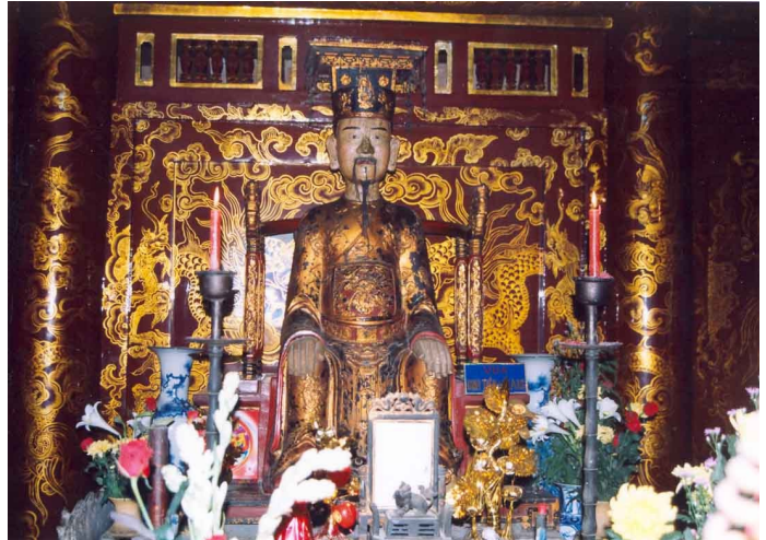
Tượng vua Đinh Tiên Hoàng tại Cổ đô Hoa Lư

Đền thăm Cổ đô Hoa Lư thuộc xã Trường Yên, huyện Hoa Lư, tỉnh Ninh Bình, du khách sẽ thấy ở ngay gian giữa đền vua Đinh có bức đại tự đề ba chữ được sơn son thiếp vàng lộng lẫy: “Chính Thống Thủy” (Mở nền chính thống). Với con mắt của các nhà nho xưa, Đinh Bộ Lĩnh được coi như người mở đường cho các triều đại phong kiến Trung ương tập quyền ở Việt Nam, thống nhất đất nước sau