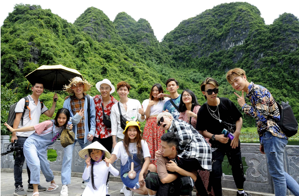
Các TikToker thực hiện quay phim tại Khu du lịch sinh thái Tràng An

Chương trình #HelloNinhBinh trên nền tảng Tiktok được kỳ vọng là một kênh xúc tiến quảng bá du lịch, tạo sự lan tỏa, góp phần tôn vinh những danh lam thắng cảnh, giá trị lịch sử, văn hóa của Ninh Bình, mang đến một góc nhìn mới đưa du lịch Ninh Bình nói riêng và du lịch Việt Nam đến gần hơn với du khách trong nước và quốc tế./.