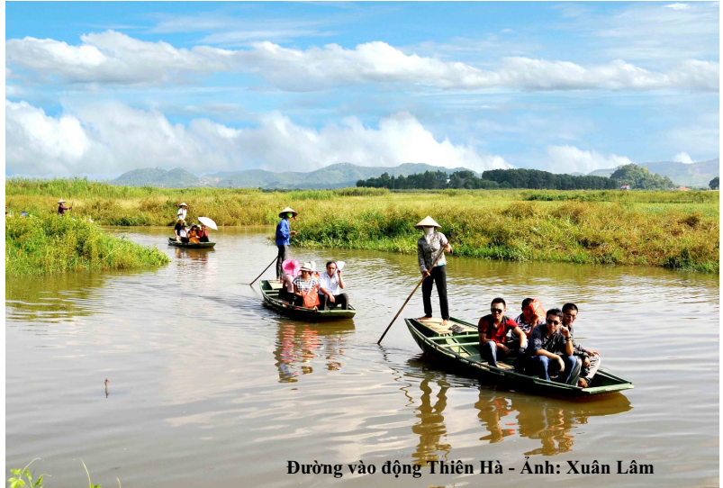
Đường vào động Thiên Hà

T háng 8 là thời điểm bước vào tiết lập Thu, thời tiết lúc này đã trở nên khá mát mẻ và dễ chịu. Thiên nhiên cảnh vật dường như cũng trở nên lãng mạn hơn. Có lẽ đây là khoảng thời gian tuyệt vời để du khách trải nghiệm một chuyến đi thú vị đến với những địa điểm lý tưởng ở Ninh Bình, một trong những hành trình ấy là đi tham quan động Thiên Hà.