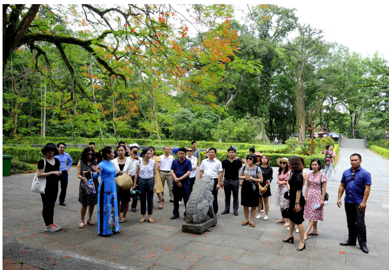
Khảo sát tiềm năng du lịch ở Thanh Hóa để liên kết phát triển

Được sự quan tâm chỉ đạo của Chính phủ; Bộ Văn hóa, thể thao và Du Lịch; Tỉnh Ủy, UBND tỉnh Ninh Bình cùng với sự quyết tâm, nỗ lực của ngành Du lịch, các cơ quan, ban ngành, chính quyền địa phương, doanh nghiệp và nhân dân tỉnh Ninh Bình trong triển khai các hoạt động Năm Du lịch quốc gia 2020 - Ninh Bình. Tin tưởng rằng các hoạt động Năm Du lịch quốc gia 2020 - Ninh Bình sẽ thành công tốt đẹp, tạo diện mạo mới trong phát triển kinh tế - xã hội nói chung và du lịch nói riêng ở Ninh Bình./.