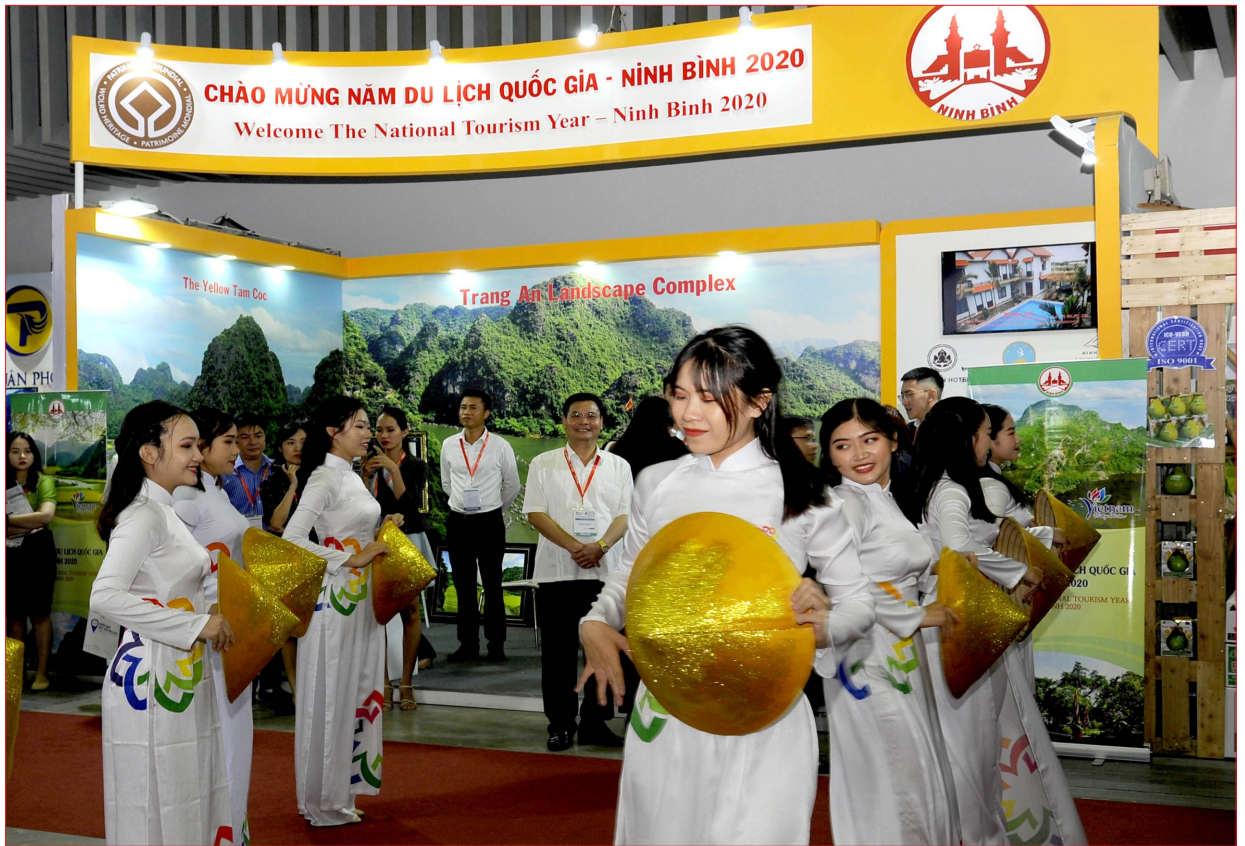
Hoạt động quảng bá chào mừng Năm du lịch quốc gia - Ninh Bình 2020 tại hội chợ ITE-HCMC 2019.