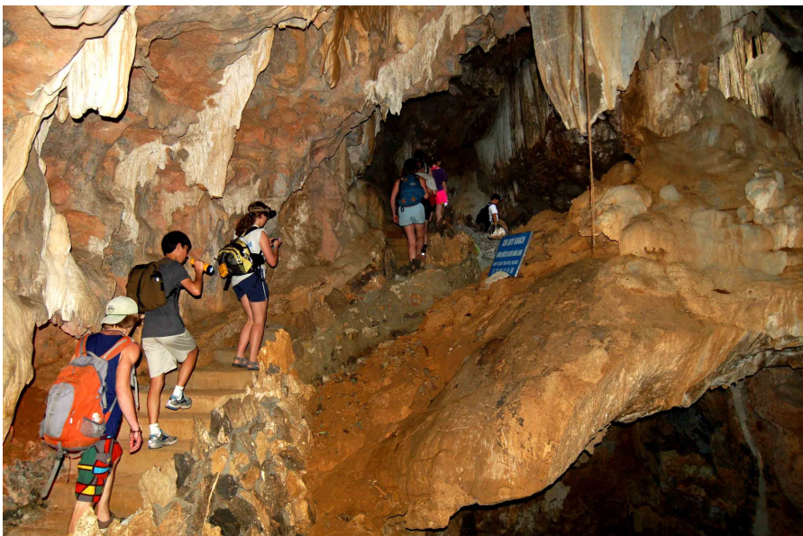
Khám phá động Thiên Hà

tìm đến động Thiên Hà là một lựa chọn thích hợp để khám phá và chiêm ngưỡng./.