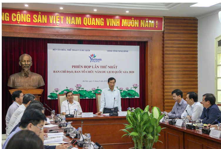
Phiên họp lần thứ nhất Ban chỉ đạo, Ban tổ chức Năm du lịch quốc gia 2020

Nhằm khai thác tiềm năng thế mạnh du lịch của tỉnh, những năm qua, Tỉnh ủy, HĐND, UBND tỉnh Ninh Bình đã ban hành nhiều chủ trương, chính sách về phát triển du lịch. Vì vậy, du lịch tỉnh Ninh Bình trong những năm gần đây đã có bước phát triển mạnh mẽ: Giai đoạn 2010 - 2018 có mức tăng trưởng bình quân 12,5 %/năm; Riêng 8 tháng đầu năm 2019 ước đón 6,1 triệu lượt khách tăng 2,13 % so với cùng kỳ năm 2018, doanh