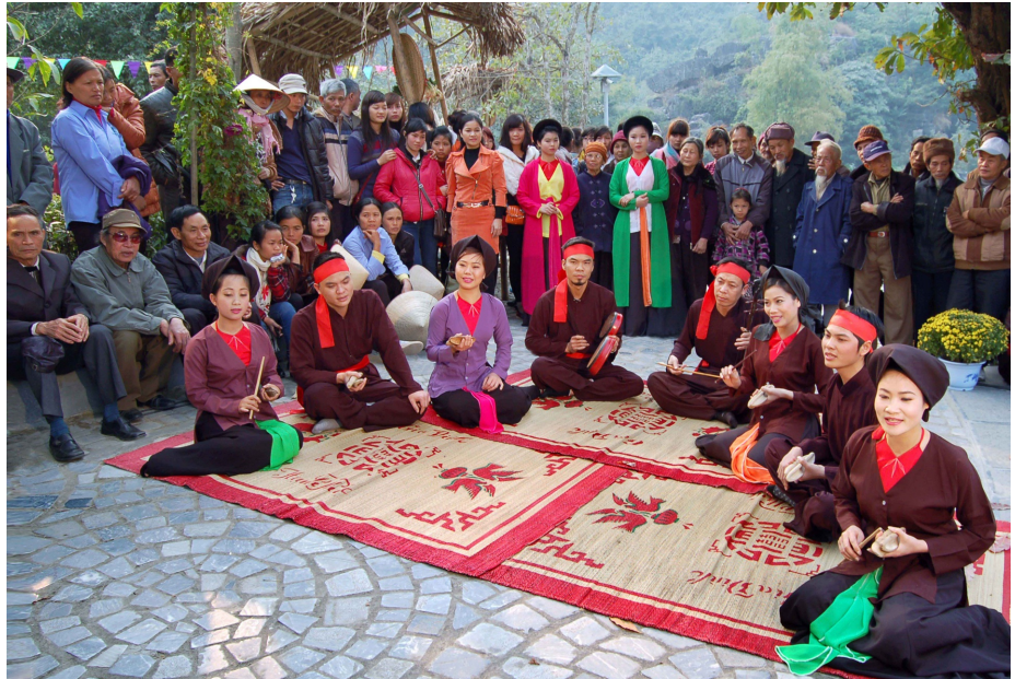
Hát Xẩm ở bến thuyền Tràng An

Trong kho tàng văn hóa nghệ thuật dân ca cổ truyền của dân tộc, nếu cải lương được coi là âm nhạc điển hình của miền Nam với ca từ da diết, sâu lắng, miền Trung với giai điệu hát ru ngọt ngào, thì hát Xẩm là một loại hình dân ca đặc trưng nhất của miền bắc.