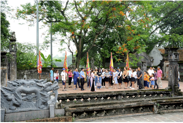
Du khách nghe hướng dẫn viên giới thiệu về Cố đô Hoa Lư - Ảnh: Xuân Lâm

đất nước của nhân dân. Giữa tình cảnh sống còn của đất nước, cần nhanh chóng khôi phục thống nhất quốc gia, với tài điều binh khiển tướng và nhận được sự ủng hộ mạnh mẽ của nhân dân, Đinh Bộ Lĩnh đã trở thành người hoàn thành sứ mệnh lịch sử - Khôi phục thống nhất quốc gia!