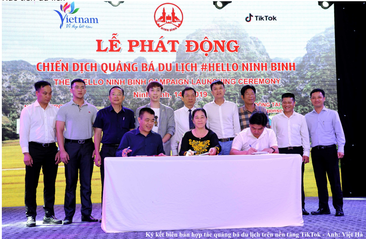
Ký kết biên bản hợp tác quảng bá du lịch trên nền tảng TikTok