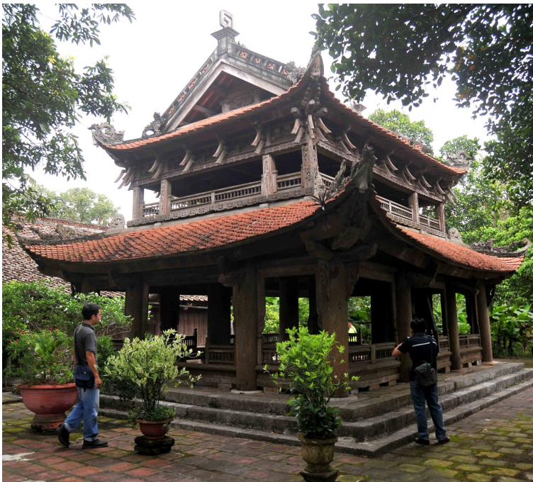
Gác chuông tại đền thờ Đức Thánh Nguyễn ở Gia Tiến

nhân dân biến Viên Quang Tự thành đền thờ trấn Bắc, trong Hoa Lư tứ trấn. Đức Thánh Nguyễn Minh Không cũng được thờ tại Điện thờ ở chùa Bái Đính cổ, chính là nơi khi xưa đến đây tìm cây thuốc chữa bệnh cho vua Lý Thần Tông, ông đã phát hiện ra động trong lòng núi đá cao khoảng 190m so với mặt đất và lập nên chùa trong động. Hiện nay, khu tâm linh núi chùa Bái Đính tọa lạc tại xã Gia Sinh, huyện Gia Viễn với diện tích hơn 1000 ha, là kết hợp giữa sự linh thiêng, trầm mặc của Bái Đính cổ tự, cùng sự nguy nga, hoành tráng của một