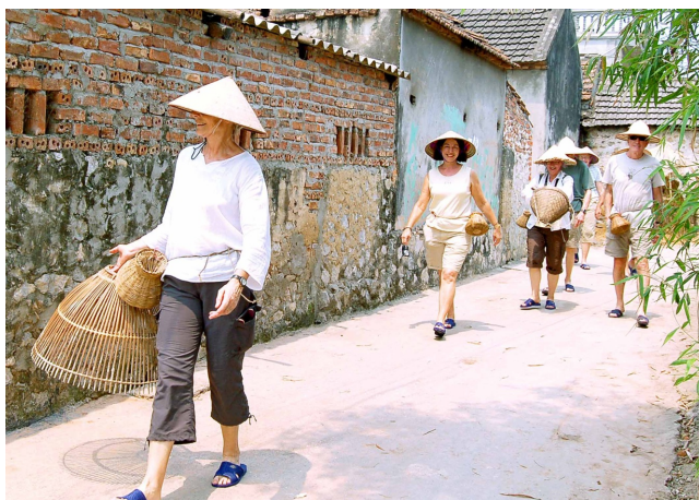
Loại hình du lịch homestay ở Vân Long

Trước hết, du lịch nông nghiệp là một loại hình du lịch tạo ra sản phẩm du lịch phục vụ du khách chủ yếu dựa vào nền tảng của hoạt động sản xuất nông nghiệp. Do vậy tài nguyên của loại hình du lịch này là tất cả những gì phục vụ cho hoạt động sản xuất nông nghiệp. Từ tư liệu sản xuất, đất đai, con người, qui trình sản xuất, phương thức tập quán kỹ thuật canh tác và sản phẩm làm ra... đến những yếu tố tự nhiên có liên quan đến sản xuất nông nghiệp như thời tiết, khí hậu, canh tác... đều là cơ sở tài nguyên cho du lịch nông nghiệp. Không gian tổ chức các hoạt động du lịch nông nghiệp cho du khách là trang trại, đồng ruộng, vườn cây, rừng trồng, những ao nuôi, cơ sở thuần dưỡng động, thực vật hoang dã... do một hộ gia đình, một trang trại, một hợp tác xã hay là một doanh nghiệp nông nghiệp quản lý... Chủ thể tham gia tổ chức du lịch nông nghiệp có thể là chủ hộ sản