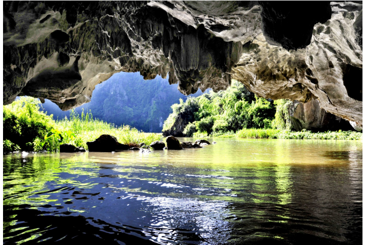
Hang cả Tam Cốc

Nằm ở xã Ninh Hải, huyện Hoa Lư, cách thành phố Hà Nội khoảng 100km về phía Nam, Tam Cốc như một bức tranh thủy mặc đẹp đến mê hồn. Đây không phải lần đầu tiên tôi đến nơi này, nhưng lần nào cũng thế, vẻ đẹp mà thiên nhiên dành tặng cho vùng đất này luôn khiến tôi trầm trồ và bị mê hoặc bởi những kiến tạo tuyệt đẹp mà tạo hóa đã ưu ái ban tặng cho vùng đất này. Ngồi thuyền xuôi theo dòng sông Ngô Đồng, len lỏi trên dòng nước trong veo, những cánh chuồn chuồn ánh lên trong nắng dịu, mùi hương nhẹ nhàng của hoa súng thoảng thoảng bay trong gió điểm thêm vài bông sen cô nứu giữ mùa hè, một bức tranh thiên nhiên hiền hòa, yên bình hiện ra trước mắt, những dãy núi trùng điệp ẩn hiện, màu xanh của cỏ cây hoa lá cứ thế trải dài, rộng mãi khiến tôi như lạc vào chốn thần tiên rộng lớn mệnh mông, kỳ vĩ mà không kém phần yên ả. Dòng sông Ngô Đồng êm ả uốn lượn giữa trùng điệp những dãy núi đá hoang sơ, chính là tuyến đường thủy đưa du khách đến các hang động xuyên núi. Hang Cả là hang dài và rộng nhất. Đây cũng là hang có nhiều nhũ đá đẹp buông xuống. Phía trong hang là những chùm nhũ đá óng ánh sắc màu và phản chiếu xuống mặt nước long lanh. Hang Hai là nơi ẩn chứa