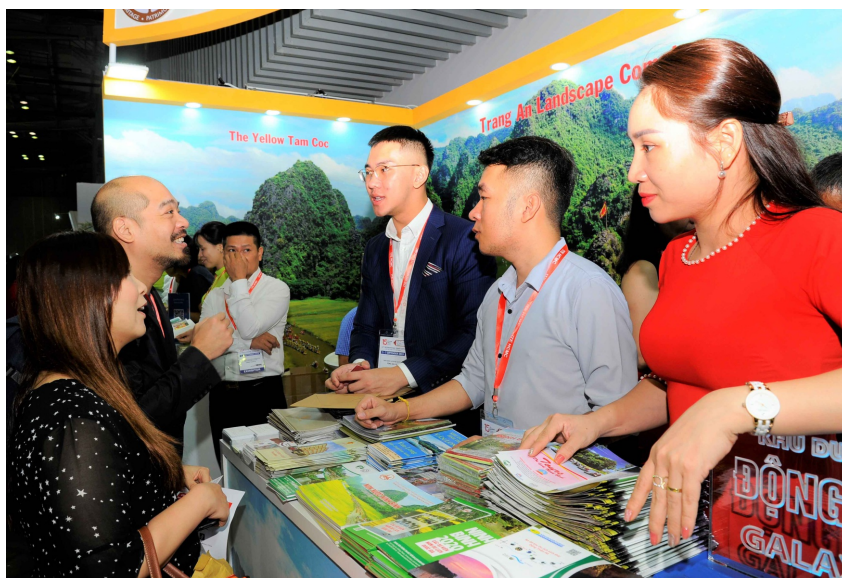
Du khách tới tìm hiểu thông tin về du lịch Ninh Bình

Qua 14 năm tổ chức, hội chợ ITE HCMC đã khẳng định được vị thế là sự kiện thương mại du lịch quan trọng của quốc gia và mang tầm khu vực, là sân chơi hiệu quả cho các doanh nghiệp trong và ngoài nước hợp tác về thị trường inbound, outbound tại Việt Nam và khu vực Mekong, góp phần quảng bá, xúc tiến và thu hút khách du lịch đến Việt Nam ngày một đông./.