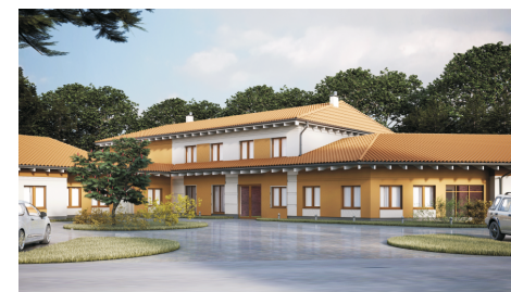
Wizualizacja pilskiego hospicjum

Dlatego podjęliśmy inicjatywę zbudowania hospicjum stacjonarnego w Pile zaczynając od zmiany stowarzyszenia w organizację pożytku publicznego w 2011 roku. Od początku 2012 roku podejmujemy się bardzo wielu działań (zbiórki publiczne, koncerty i bale charytatywne, 1% podatku dochodowego, prośby o dary rzeczowe i finansowe, poszukiwanie partnerów, sponsorów i fundatorów) w pozyskaniu środków na ten cel.