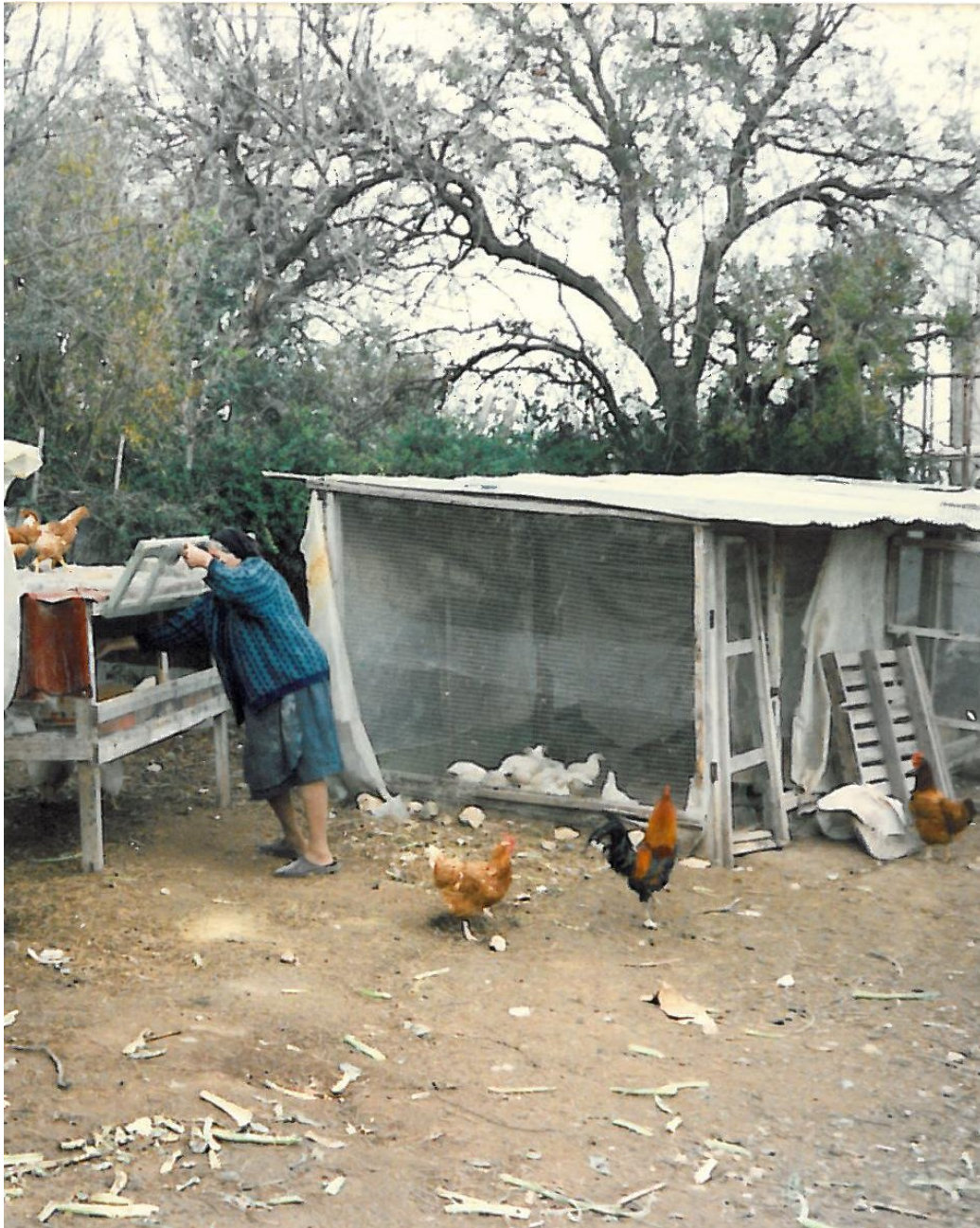
ΟΙ ΟΡΝΙΘΕΣ - δήγηση