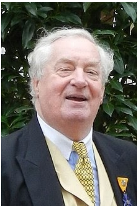
Prinz Franz Wilhelm von Hohenzollern-Preußen

Die Freimaurerei betrat 1737 Deutschland, ein Stück Land, das wir heute als Flickenteppich einzelner Staaten verstehen, weshalb sich die freimaurerischen Organisationen in Deutschland individuell entwickelten. Im größten Teil Deutschlands, in Preußen, wurden drei Großlogen gegründet. Sie wurden später die altpreußischen Großlogen genannt: Die Große Nationale Mutterloge "Die drei Globen" (1740 gegründet, die erste Großloge und bis heute erhalten), die Große Landesloge der Freimaurer von Deutschland (1770 gegründet) und die Loge Royal York der Freundschaft . Nach 1893 begannen andere deutsche Großlogen eigene Logen in Preußen zu gründen, zum Beispiel die Großloge Hamburg. In Sachsen entstand die Sächsische Landesgroßloge. Die Bayerische Großloge in Bayreuth wurde Großloge 'Zur Sonne' genannt.