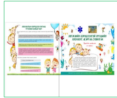
Хөгжлийн бэрхшээлтэй хүүхдийн нэг удаагийн хооллолт буюу хүнсний тусламж