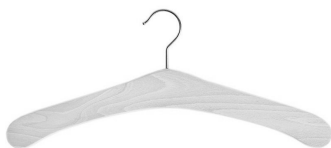
PAKIET UNISEX 10 SZT.