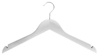
PAKIET DAMSKI 10 SZT.