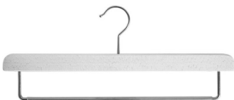
PAKIET UNISEX 10 SZT.