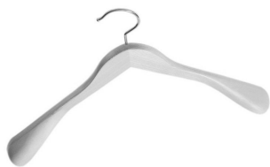
PAKIET DAMSKI 10 SZT.