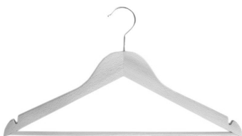
PAKIET DAMSKI 10 SZT.