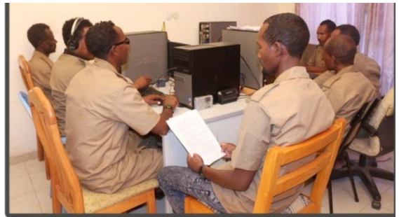
ሚድያና ልሳን ውፁዕ ህዝብና 'ዩ!!

ክፍሊ ሚድያ ዲ.ም.ህ.ት ርእሲ ወይ ድማ ዓንዲ ማእኸል ናይቲ ቃልሲ እዩ ምባል ይካኣል፡ ከምኡ ስለ ዝኾነ ድማ ካብቲ ዝተመሰረተሉ እዞን ጀሚሩ ክሳብ ሎሚ ልዑል ጠመተ ተዋሂብዎ ብዓቕሚ ሰቡን ማተርያልን ክዓቢ ተገይሩ እዩ። ከም ውፅኢቲ ካኣ በዝሒ ንዘለወን ብሳንባ ናይቲ ስርዓት ጥራይ ዘተንፍሳ ሞያዊ ስነ ምግባር ዘይብለን ሚድያታት ወያነ ንዘቃልሑ ናይ ሓሶት ፈነወ ገጢሞም ኣብ ምምካትን ፖለቲካዊ ንቕሓትን ጥንካረን፡ ንፁርነት ዕላማን መትከልን ናይቲ ውድብ ንህዝቢ ኣብ ምልላይን ቁፅሪ ኣደ እዩ።