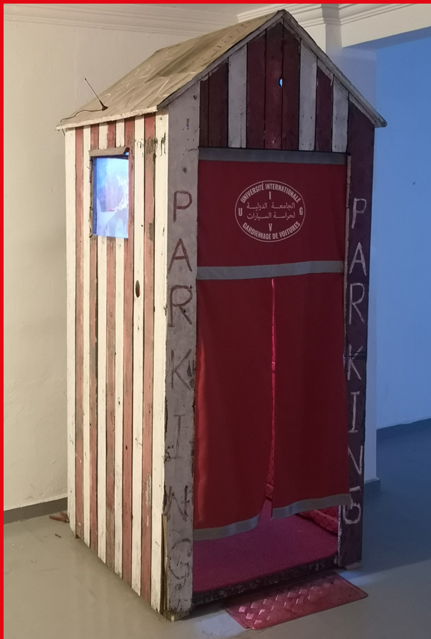
Dessus: Vue extérieure de la cabine d'apprentissage à l'UIGV Marrakech

Ci contre : capture vidéo du cours de Gardiennage proposé par Abderrahim et diffusé dans la cabine.