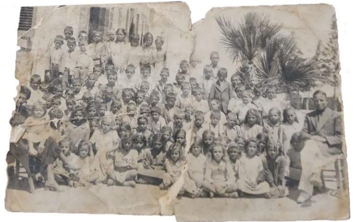
Δημοτικό σχολείο Χλώρακας 1949

Μετά το μυστήριο, ο τατάς κρατώντας το μωρό αγκαλιά και ακολουθούμενος από τον ιερέα, τους γονείς και όσους είχαν παραστεί στη βάπτιση, πήγαιναν εν πομπή στο σπίτι των γονέων. Η μητέρα στεκόταν εντός της θύρας, και αφού έκανε τρεις μετάνοιες, παραλάμβανε το μωρό από τον τατά, ο οποίος στεκόταν στο κατώφλι. Ύστερα ασπαζόταν το χέρι του ιερέως και του αναδόχου, και εισέρχονταν όλοι εντός της οικίας όπου έστρωναν γλέντι.