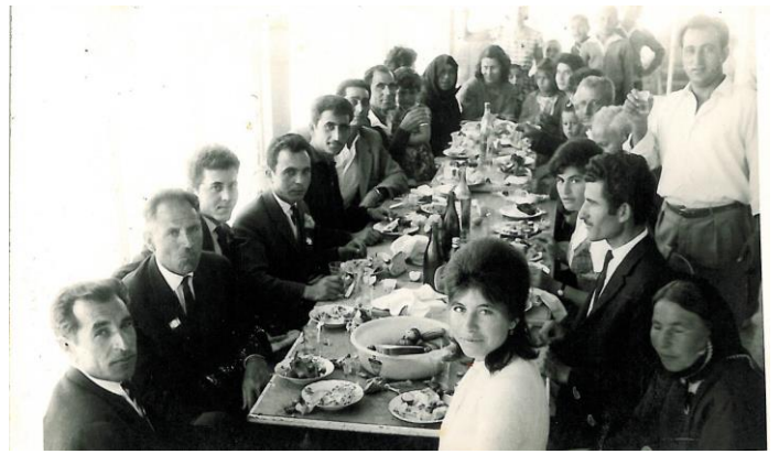
Βάφτιση κόρης Χαρ. Καραμανλή

Μετά τις 40 μαζί με το μωρό πήγαιναν στην εκκλησία για να διαβαστούν από τον παπά.