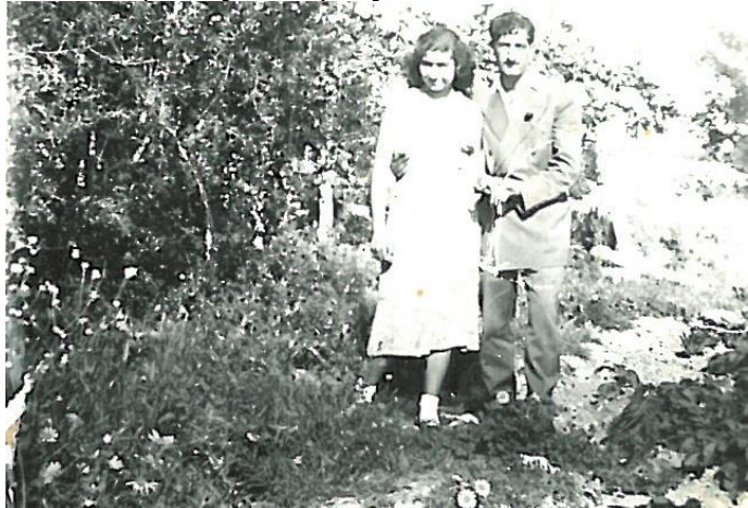
Χαρτώματα Μιρτή Στύρου-Οξεία

περιουσιακά στοιχεία από ακίνητα, ζώα, δένδρα, προικιά, χρυσαφικά, παράδες κ.λ.π. Ακολούθως το κατάθεταν στο Κτηματολόγιο ή σε άλλη αρμόδια κυβερνητική αρχή, και ήταν δεσμευτικό όπως ένα κκοτσιάνι ή τίτλος ιδιοκτησίας.