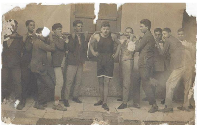
Διαγωνισμοί στη πλατεία της εκκλησίας

Οι Χριστιανοί κατά τη διάρκεια της τρώνε μόνο νησίσιμα φαγητά, και τοιουτοτρόπως καθαρίζει το σώμα τους πνευματικά και σωματικά. Η νηστεία διαρκεί τώσες μέρες, όσες ήταν και οι μέρες νηστείας του Χριστού στην έρημο. Το πέταγμα του χαρταετού, είναι ένα έθιμο μεταγενέστερο αυτής της μέρας. Οι κάτοικοι παρέες βγαίνουν στις παραλίες της Χλώρακας, παίρνοντας μαζί τους νησίσιμα φαγητά, και με κέφι διασκεδάζουν.