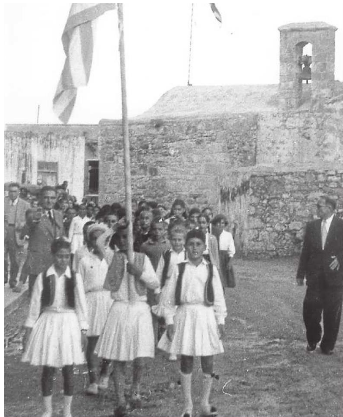
Παρέλαση μπροστά από την αρχαία εκκλησία

Τα απογεύματα του τριημέρου οι κάτοικοι μαζεύονταν στην κεντρική πλατεία της εκκλησίας όπου έπαιζαν παραδοσιακά παιχνίδια και διαγωνίσματα όπως ζιζιρο, σακουλοδρομίες, γαΐδουροδρομίες, αυγοδρομίες, τράβηγμα σχοινού.