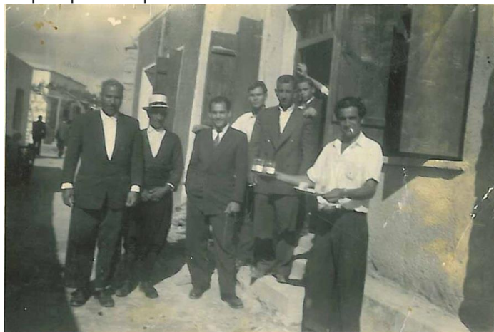
Καφενείο του Βάννα

σκετς επί σκηνής, και κάποτε με παρελάσεις, τις επετείους της 25 ης Μαρτίου της επανάστασης του 1821, της 1 ης Απριλίου του αγώνα της ΕΟΚΑ εναντίον των Βρετανών Αποικιοκρατών, της 1 ης Οκτωβρίου για την ανακήρυξη της Κυπριακής δημοκρατίας, και της 28 ης Οκτωβρίου για τον αγώνα εναντίον του Ιταλογερμανικού φασισμού στον Β' παγκόσμιο πόλεμο.