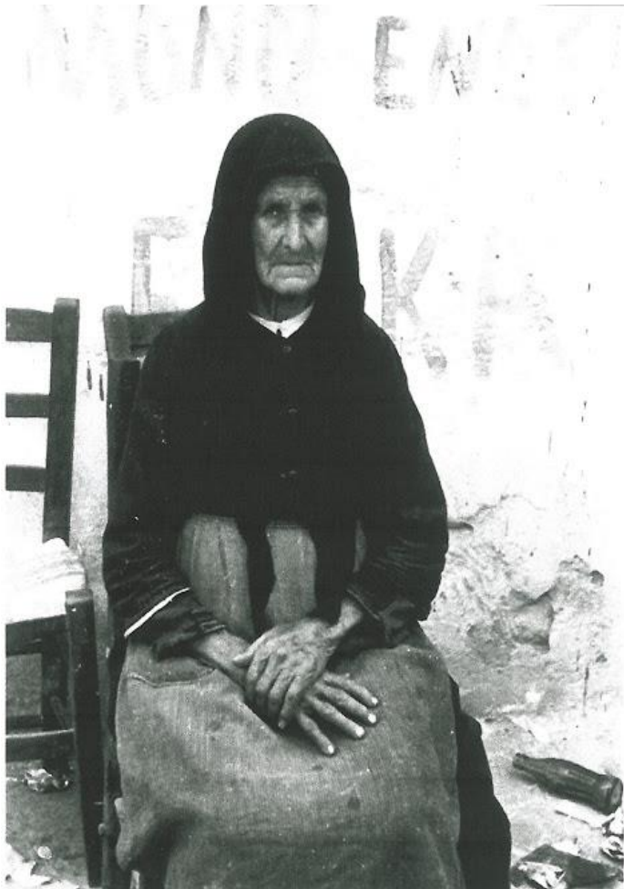
ΧατζηΕλενούα η μαμμή