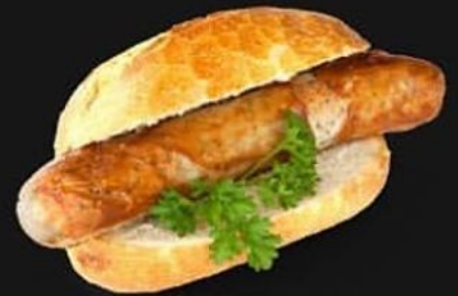
BRATWURST 285 KALORIEN

L'association cacao maca & mesquite est d'autant plus délicieuse et vient apporter une touche caramel noisette au caractère fort du cacao ☺ Plantes adaptogènes que nous utilisons dans quasi la totalité de nos produits en boutique ☐