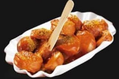
CURRYWURST 251 KALORIEN