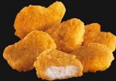
CHICKEN NUGGETS 296 KALORIEN