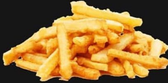
POMMES 311 KALORIEN