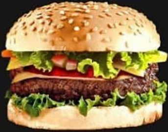
HAMBURGER 289 KALORIEN