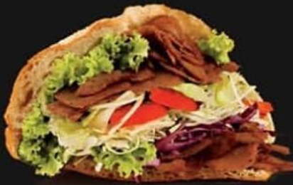
DÖNER 189 KALORIEN