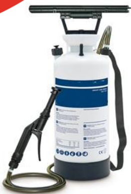
Pjenjenje – Art.Br. U-31.01040