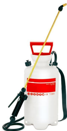
Špricanje – Art.Br. U-31.01225