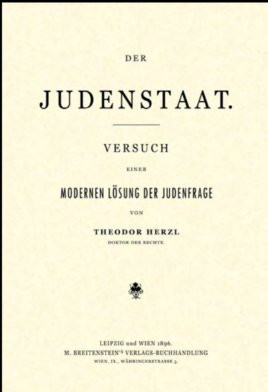
Der Judenstaat von Theodor Herzl

Weitere Hinweise und ausführlichere Beschreibungen u.a. in folgenden Schriften: