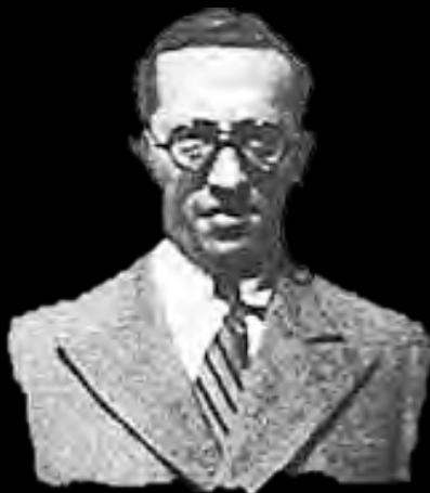
Chaim Arlosoroff, 1933 von vermutlich zwei Arabern ermordet