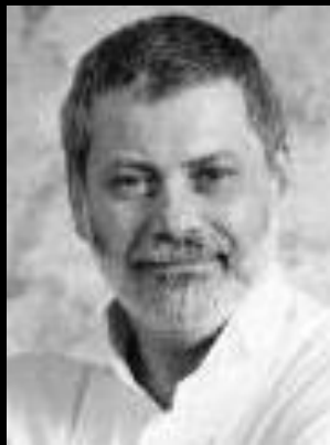
Der Jude Edwin Black belegte die wirtschaftlichen Auswirkungen des jüdischen Wirtschaftskrieges gegen das Deutsche Reich

Die jüdischen Führer blufften nicht . Der Boykott war nicht nur ein metaphorischer Kriegsakt: Er war ein gut ausgedachtes Mittel, um Deutschland als politische, soziale und wirtschaftliche Einheit zu zerstören. Der weitreichende Zweck des jüdischen Boykotts gegen Deutschland war, es in den Bankrott zu treiben mittels der Reparationszahlungen, die Deutschland nach dem ersten Weltkrieg auferlegt wurden, und Deutschland entmilitarisiert und verletzlich zu halten.