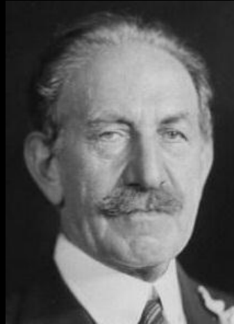
Samuel Untermyer war Kopf des jüdischen Krieges gegen das Deutsche Reich

Sie wurde unter der Schirmherrschaft der selbsternannten „ World Jewish Economic Federation “ abgehalten, deren gewählter Präsident der berühmte New Yorker Rechtsanwalt und politische Agent Samuel Untermyer war.