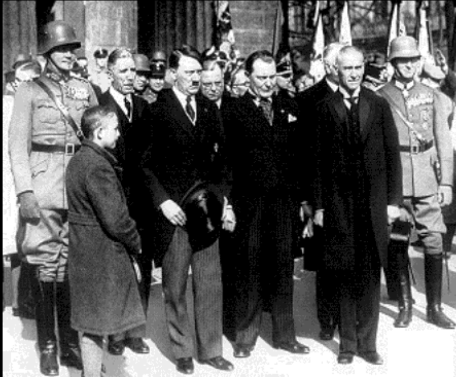
Adolf Hitler im März 1933

Die direkte Folge davon war, daß die deutsche Regierung am 1. April einen eintägigen Boykott jüdischer Geschäfte in Deutschland ankündigte. Propagandaminister, Dr. Joseph Goebbels , kündigte an, daß wenn nach dem eintägigen Boykott keine weiteren Angriffe auf Deutschland gemacht würden, der Boykott auch beendet würde.