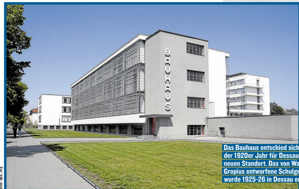
Das Bauhaus entschied sich Mitte der 1920er Jahre für Dessau als neuen Standort. Das von Walter Gropius entworfene Schulgebäude wurde 1925–26 in Dessau errichtet.

Die Reportage wurde durch die Zusammenarbeit mit der Thüringen Tourismus GmbH, der IMG Sachsen-Anhalt mbH sowie Tourismus NRW e.V. ermöglicht.