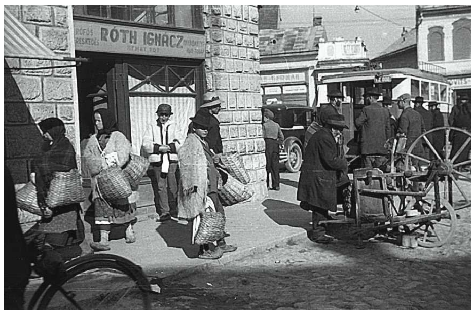
• Rok 1939, ulica w miasteczku Chust. Na jego przedmieściach Karpaccy Strzelcy Siczowi na kilka godzin zatrzymali Węgrów. Stąd w marcu 1939 r. ewakuował się do Rumunii rząd Ukrainy Karpaczej.

Koalicja rumuńsko-czechosłowacka, wspierana przez Zachód (głównie Francję), rozbiła Węgierską Republikę Rad, a 3 sierpnia 1919 r. do Budapesztu wkroczyli Rumunii. Przez kilka miesięcy okupowali nawet całe Węgry z wyjątkiem rejonu je-