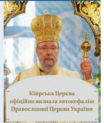
Кіпрська Церква офіційно визнала автокефалію Православної Церкви України

Православна Церква Кіпру визнала автокефалію Православної Церкви України. Передісторія: Собор ієрархів Грецької (Елладської) Церкви 12 жовтня 2019 року визнав автокефальну Православну Церкву України. Елладська Церква стала першою після Вселенського Патріархату з-поміж помісних православних Церков світу, яка визнала ПЦУ. 8 листопада 2019 року найстаріший після Вселенського патріархату Олександрійський патріархат офіційно визнав автокефальну Православну Церкву України. 5 січня 2019 року у Стамбулі підписали томос про автокефалію української Церкви, 6 січня патріарх Варфоломій передав його митрополиту Київському і всієї України Епіфанію. (Українська правда)