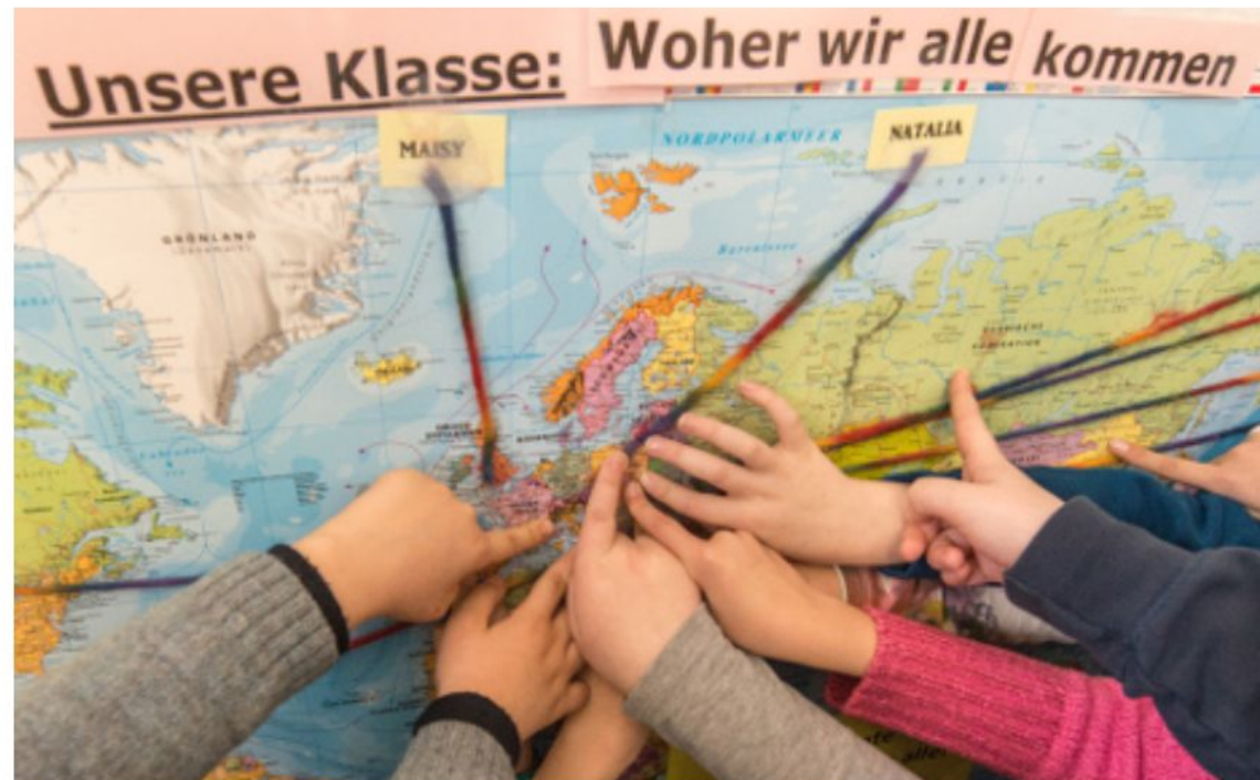
An international German class point to where they are from on the map.