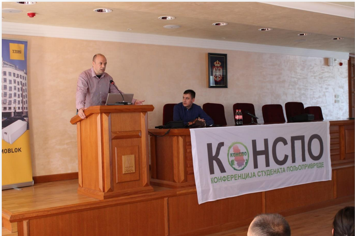
Представници Societe Generale Србије, причају о понуди за младе