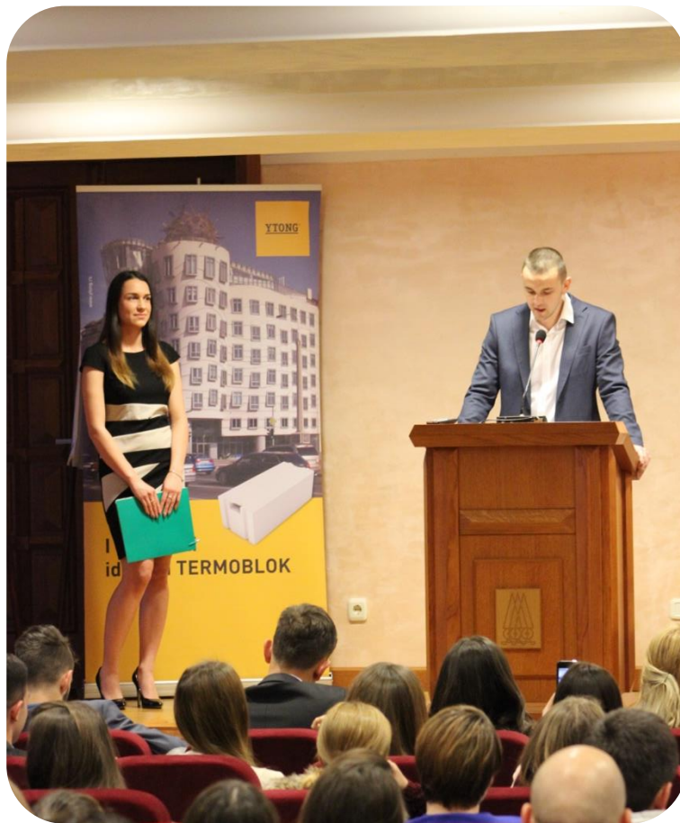
Председник Студентског парламента Пољопривредног факултета отвара конференцију