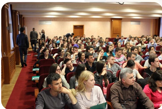
Окупљање студената у конференциској сали конгресног центра Романија