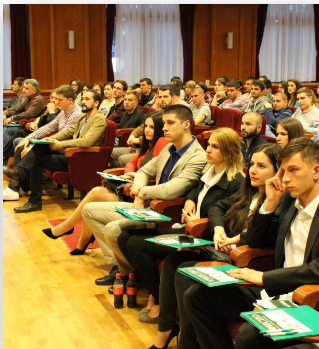
Предствници компаније ЈТІ причају о примени најбоље праксе у производњи дувана