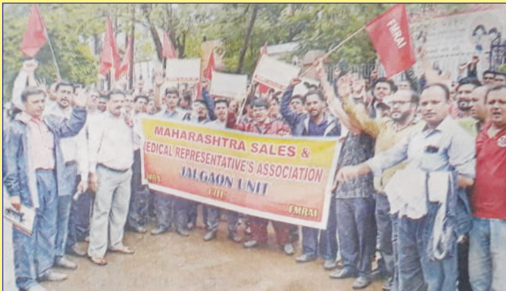
जळगाव, जि. जळगाव