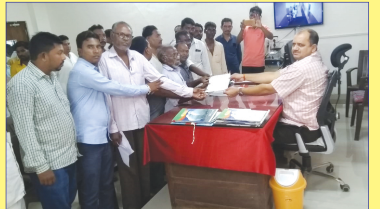
शहादा, जि. नंदुरबार