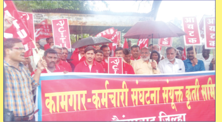
औरंगाबाद, जि. औरंगाबाद