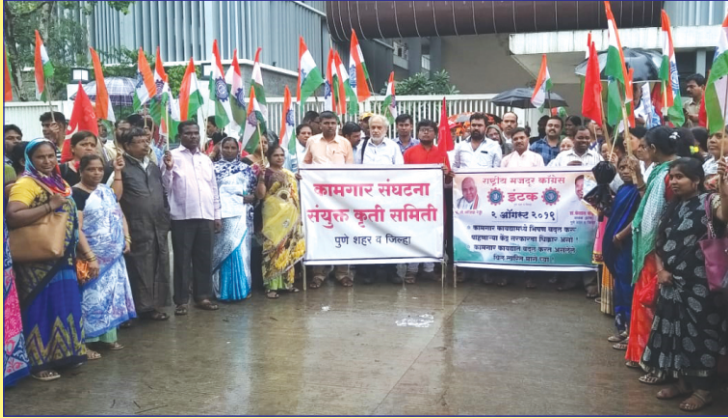
पुणे, जि. पुणे