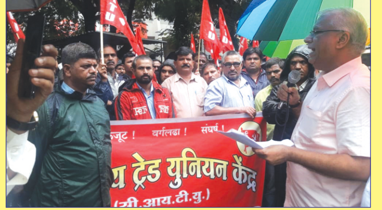
नाशिक, जि. नाशिक