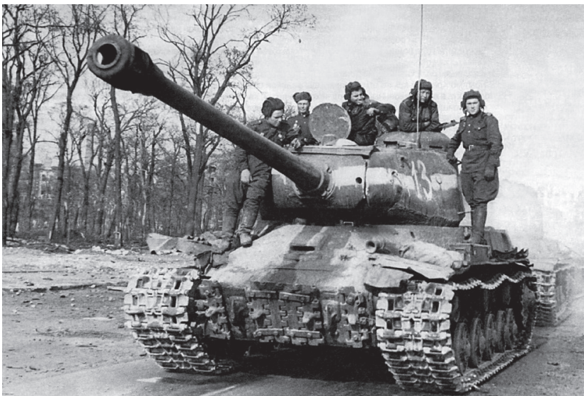
▲ Ci-dessus : IS-2 modèle 1944. La puissance de son canon de 122 mm en fait un danger mortel pour les Tiger I. Droits réservés

▲▲ En haut : Les Allemands estiment qu'avec ses optiques de tir TZF9b, le tireur d'un Tiger I a 93% de chance de toucher une cible de 2,5 sur 2 m à 1 000 m en conditions de combat. Carpaneto saura faire bon usage de ce point fort face aux T-34 soviétiques. Droits réservés