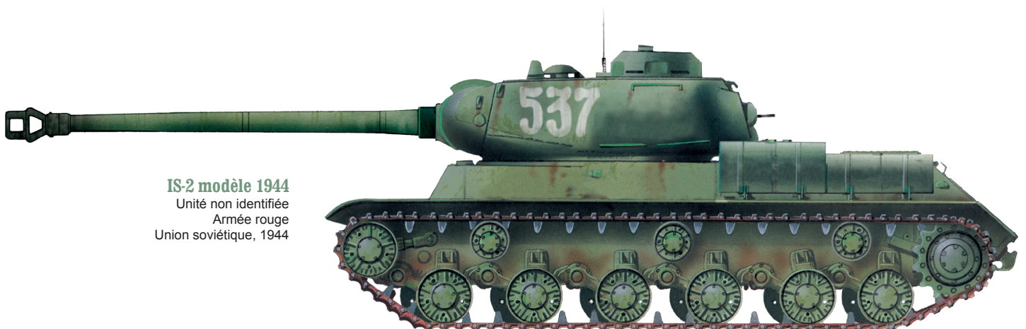
IS-2 modèle 1944 Unité non identifiée Armée rouge Union soviétique, 1944

probablement encore un canon de 122 mm d'un tank lourd JS-2, pratiquement la seule machine soviétique capable de surclasser un Panzer VI Ausf. E . L'engin de Carpaneto est touché de plein fouet. L'obus heurte le flanc du Tiger. Le choc fait caler le gros 12 cylindres Maybach et des flammes commencent à s'en échapper. Des durites d'essence viennent de céder sous l'impact. En face, le chef de char russe décide d'achever le fauve blessé et double son coup. Le second projectile se fraye un chemin dans l'acier du Panzer qui explose quelques dizaines de secondes plus tard. Alfredo Carpaneto et son équipage n'ont pas le temps d'évacuer et sont tués sur le coup. L'homme venait à peine de fêter ses 30 ans. Reconnu comme un soldat exceptionnel, l'as italien reçoit la Ritterkreuz des Eisernen Kreuzes (RK, Croix de chevalier de la Croix de Fer) à titre posthume le 28 mars 1945, sur proposition faite le 16 du même mois, pour avoir accompli de grands actes de bravoure face à l'ennemi. Avec plus d'une cinquantaine victoires créditées, dont la majorité sur Tiger, Carpaneto s'est hissé parmi les meilleurs chefs de chars de la schwere Panzer-Abteilung 502 et il reste dans les souvenirs d'un Otto Carius comme un homme au tempérament enjoué, un artiste casse-cou doublé d'une tête de mule qui aura eu raison de l'incompétence d'un officier supérieur ! ■