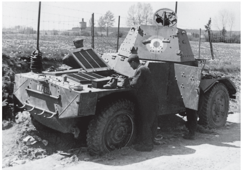
▼ Automitrailleuse Panhard AMD 178 mise hors de combat en mai/juin 1940. Son canon de 25 mm est tout à fait capable de détruire un Panzer III . AMC # E025875