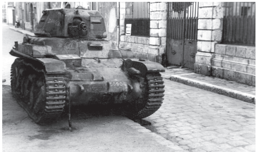
▲ Char léger Renault R35 abandonné par son équipage de 2 hommes. S'il pêche par son armement peu puissant, ce blindé reste difficile à mettre hors de combat, car sa protection épaisse de 40 mm résiste bien aux projectiles de 3,7cm tirés par le Panzer III .