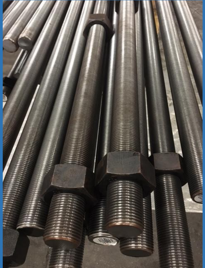
Draadstangen M52 in 10.9