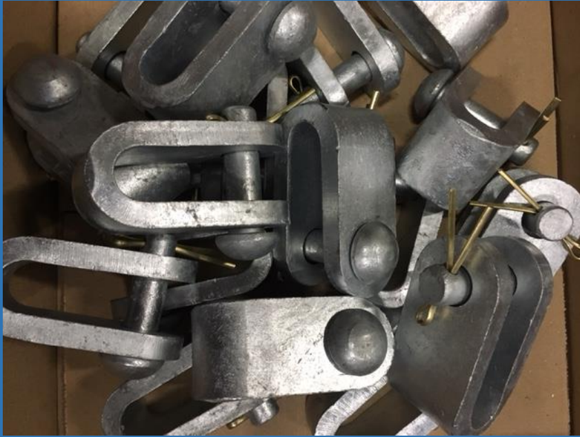
U-beugels met messing pen