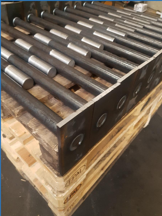
Draadsnijden met laswerk