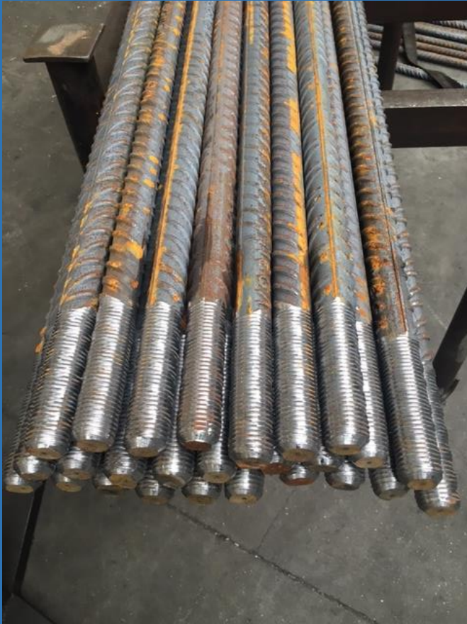
BE500S diameter 32 met schroefdraad M33