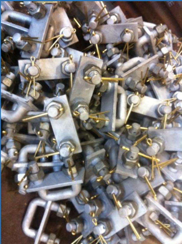
U-beugels met messing pen