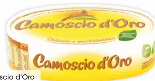
Camoscio d'Oro g 200 al kg € 11,95