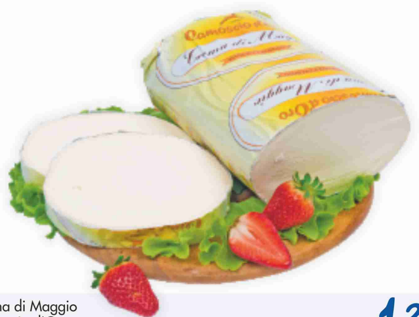
Crema di Maggio Camoscio d'Oro al kg € 12,90