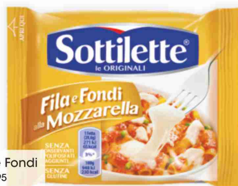
Sottilette Fila e Fondi g 200 al kg € 7,95