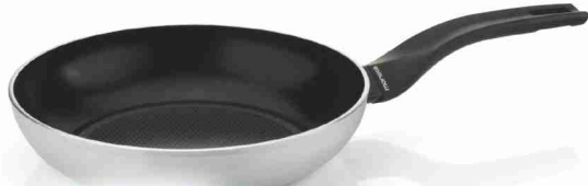
PADELLA CM 24 35 BOLLINI + € 9,90 OPPURE 35 BOLLINI + 990 PUNTI