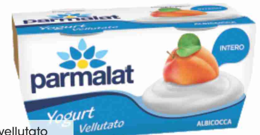
Yogurt vellutato Parmalat vari gusti g 125x2 al kg € 2,76