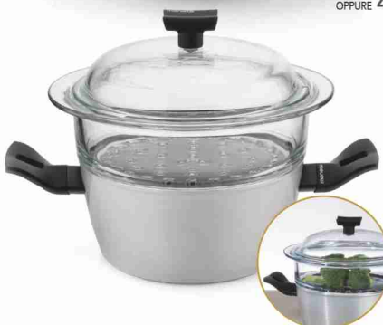
SET PER COTTURA A VAPORE CM 20 55 BOLLINI + € 27,90 OPPURE 55 BOLLINI + 2.790 PUNTI