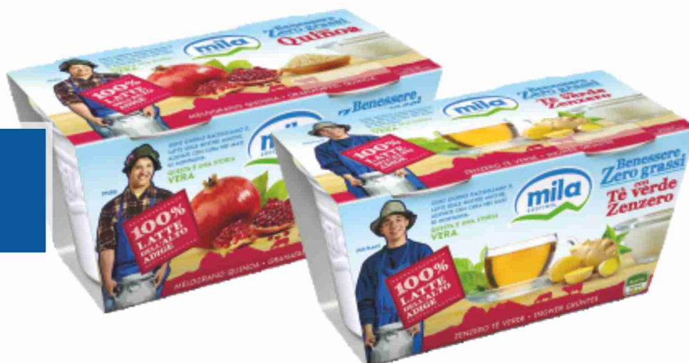
Yogurt magro Mila vari gusti g 125x2 al kg € 2,76