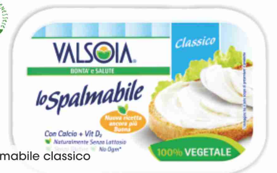
Lo Spalmabile classico Valsoia g 125 al kg € 10,32