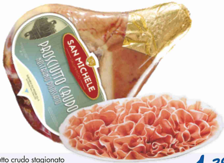
Prosciutto crudo stagionato San Michele al kg € 13,90