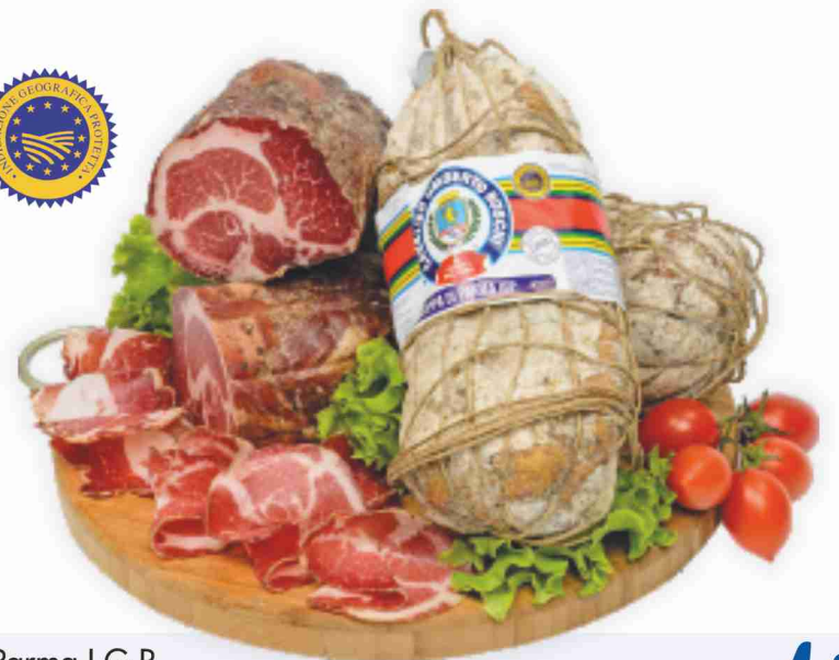
Coppa di Parma I.G.P. Cav. Umberto Boschi al kg € 18,90