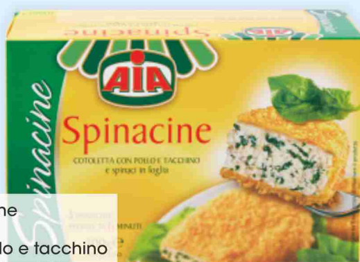
Spinacine Aia con pollo e tacchino g 300 al kg € 5,97