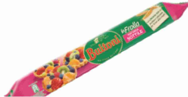
Base la Frola Buitoni sottile, g 230 al kg € 6,04