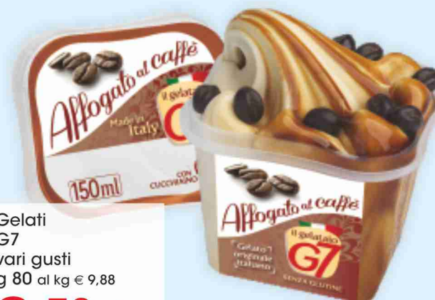
Gelati G7 vari gusti g 80 al kg € 9,88