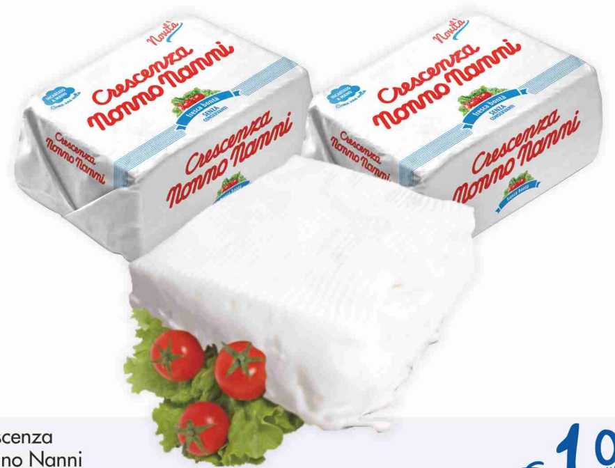
Crescenza Nonno Nanni al kg € 10,90