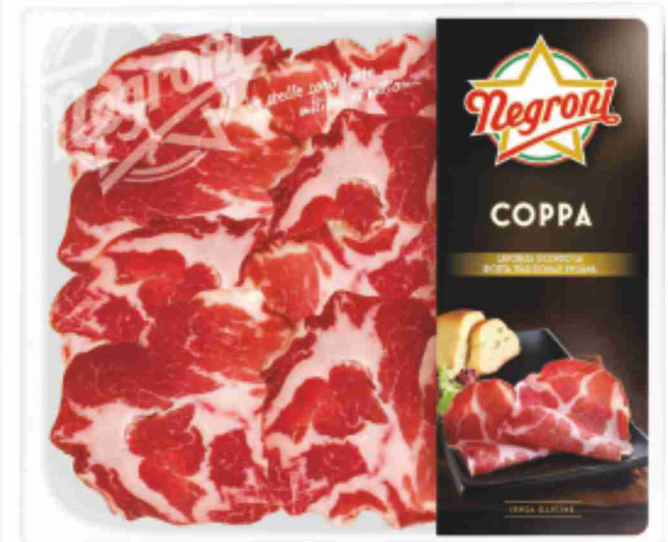
Coppa Negroni g 100 al kg € 18,90