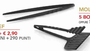
MOLLA PESCE/CARNE 5 BOLLINI + € 2,90 OPPURE 5 BOLLINI + 290 PUNTI