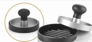
PRESSA PER HAMBURGER 20 BOLLINI + € 6,90 OPPURE 20 BOLLINI + 690 PUNTI