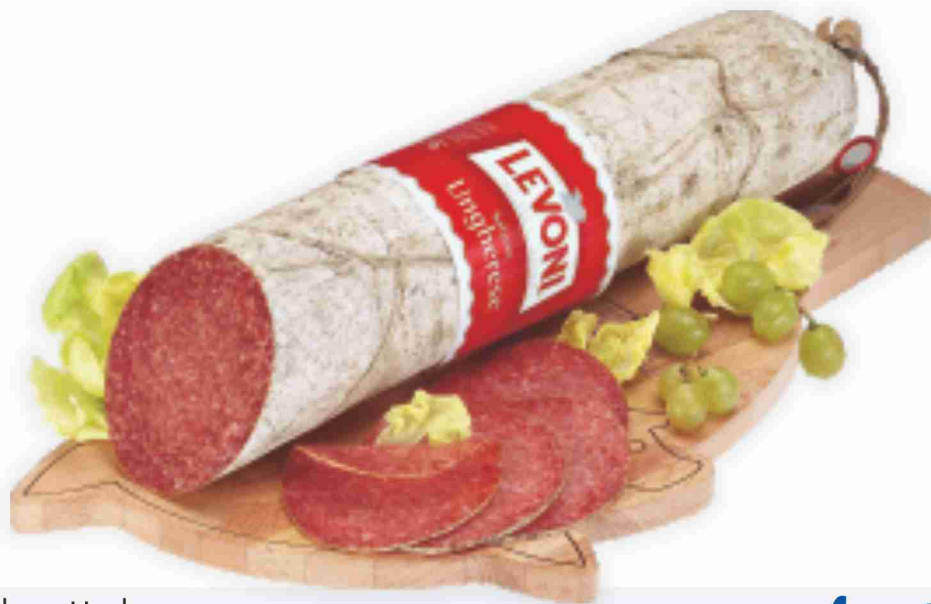
Salame Ungherese Levoni al kg € 17,90