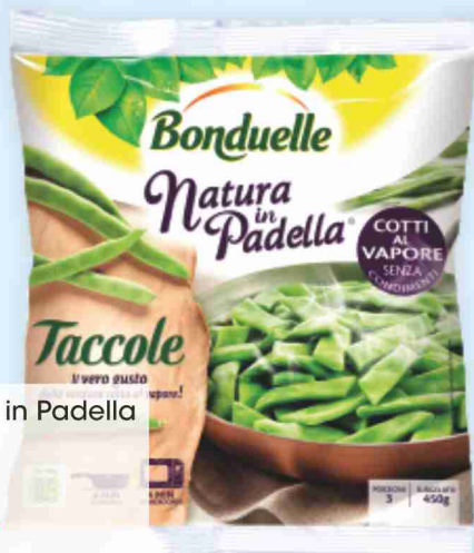
Taccole Natura in Padella Bonduelle g 450 al kg € 3,31