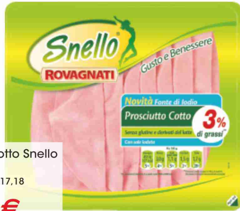
Prosciutto cotto Snello Rovagnati g 110 al kg € 17,18