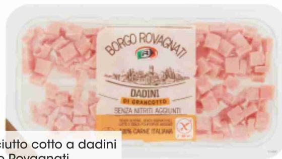
Prosciutto cotto a dadini Borgo Rovagnati g 90 al kg € 16,56