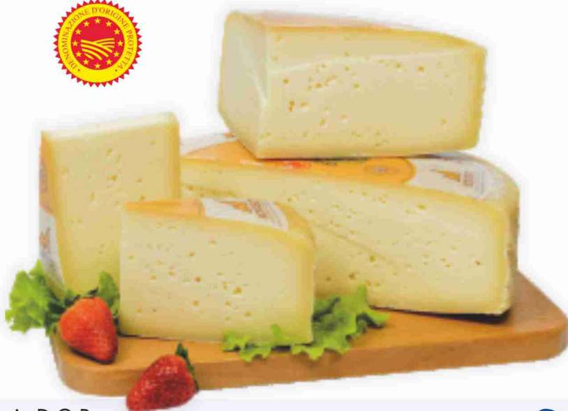
Montasio D.O.P. al kg € 9,90