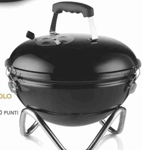
BARBECUE DA TAVOLO 60 BOLLINI + € 29,90 OPPURE 60 BOLLINI + 2.990 PUNTI