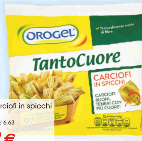
Cuori di carciofi in spicchi Orogel g 300 al kg € 6,63