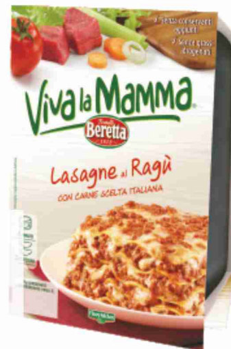
Lasagne al ragù Viva la Mamma Beretta g 400 al kg € 7,48