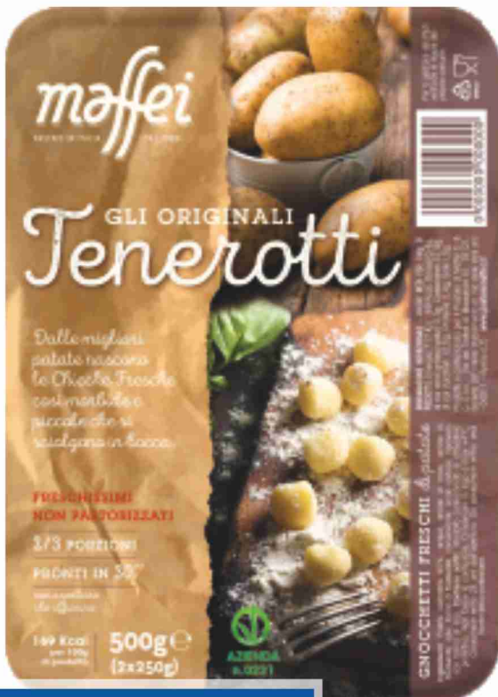
Gnocchetti Tenerotti Maffei g 250x2 al kg € 2,98