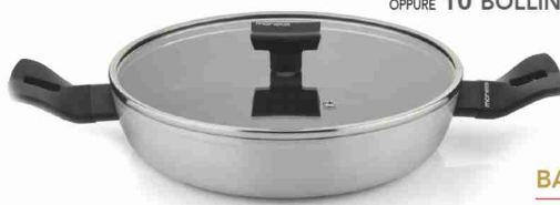
TEGAME CM 24 2 MANIGLIE 40 BOLLINI + € 13,90 OPPURE 40 BOLLINI + 1.390 PUNTI