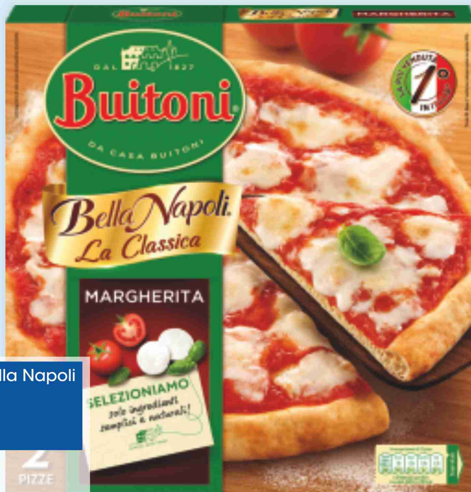
Pizza Margherita Bella Napoli Buitoni 2 pizze g 660 al kg € 4,53