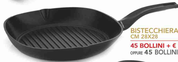
BISTECCHIERA CM 28X28 45 BOLLINI + € 14,90 OPPURE 45 BOLLINI + 1.490 PUNTI