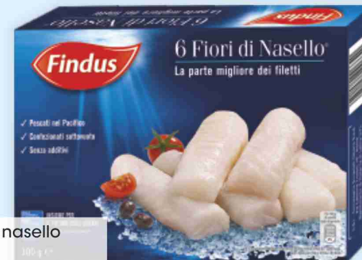
Fiori di nasello Findus g 300 al kg € 16,63