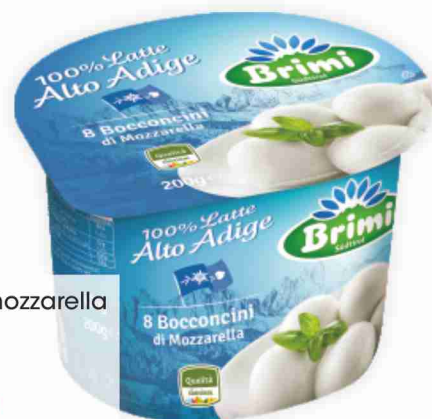
Bocconcini di mozzarella Brimì g 200 al kg € 8,95