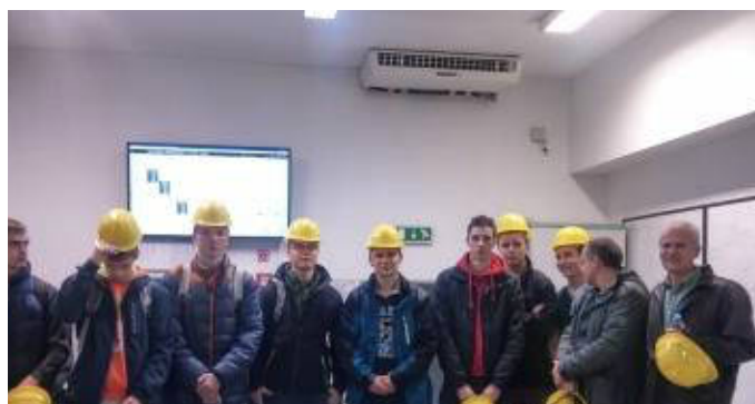
EXKURZIA - TEPLÁREŇ