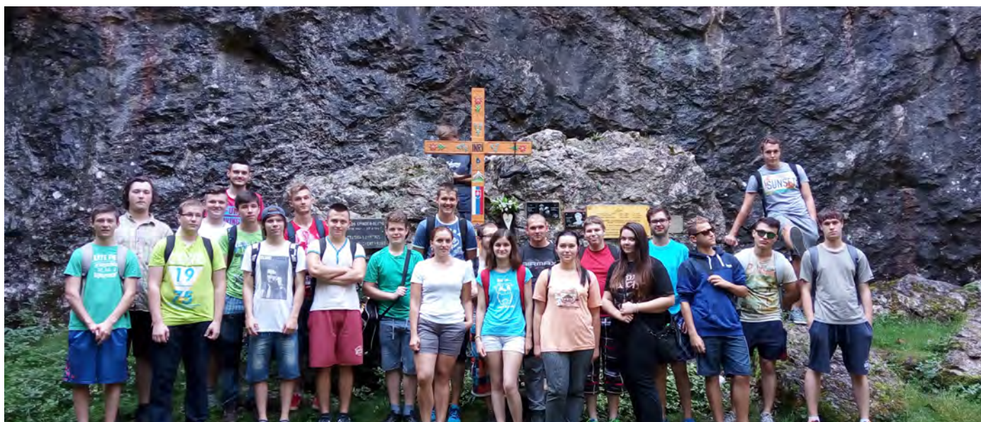
KURZ OCHRANY ŽIVOTA A ZDRAVIA