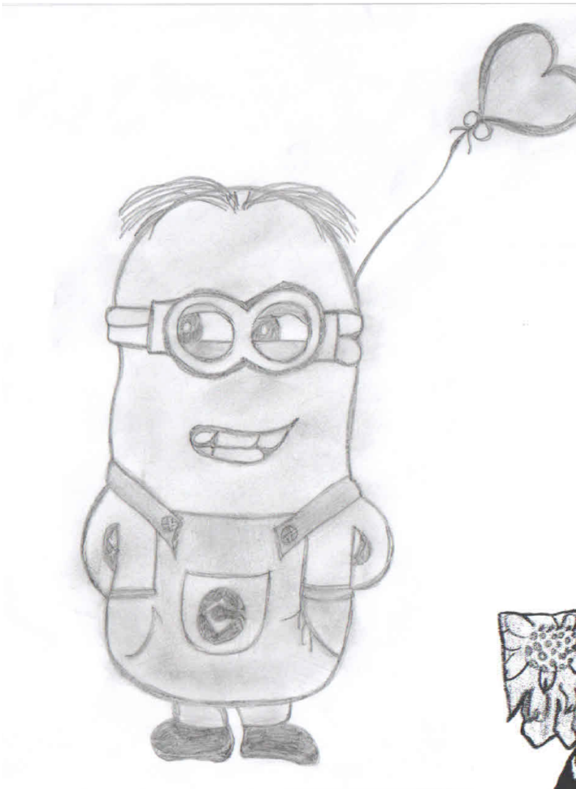
Michal Kostelanský 1.D