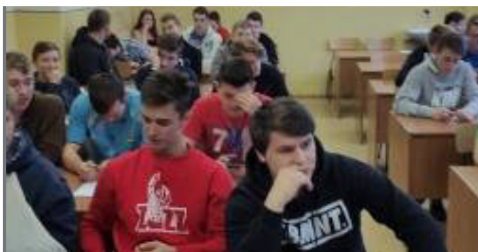
OLYMPIÁDA ĽUDSKÝCH PRÁV