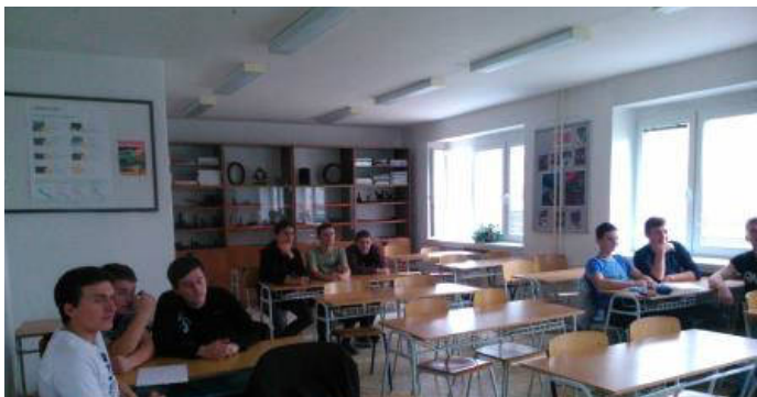
TECHNIKA V NÁS