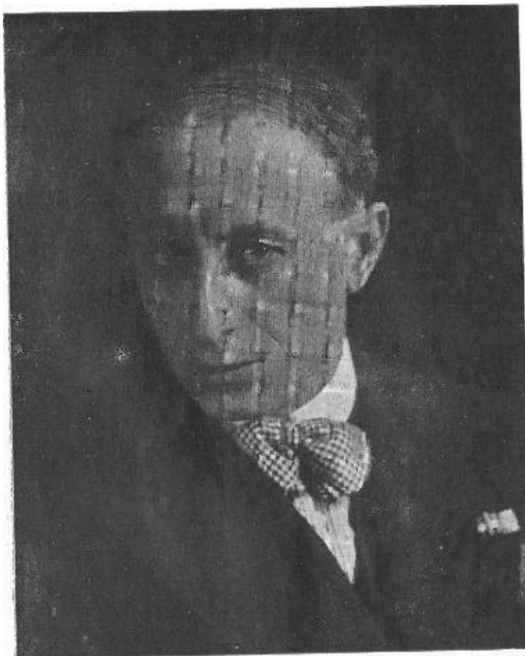
S. E. On. AUGUSTO TURATI

1) Non occorre occuparci dell'art. 8, che prevede la successione del Capo del Governo e d'alcuni membri del Gran Consiglio, augurandoci dal più profondo del cuore, che la cosa possa soltanto interessare i nostri... nipoti! ( N. dell'A. )