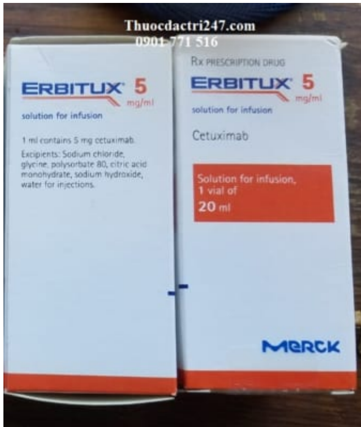
Thuốc erbitux 100mg/20ml cetuximab điều trị ung thư (1)