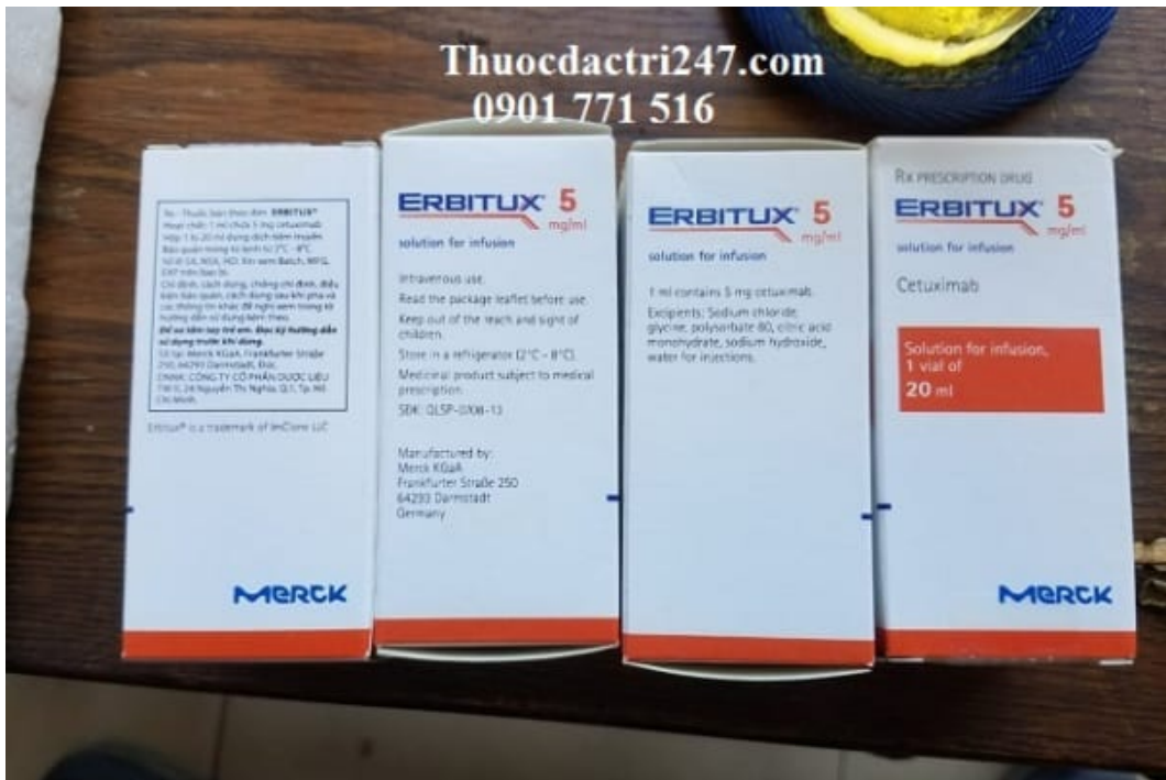
Thuốc erbitux 100mg/20ml cetuximab điều trị ung thư (2)