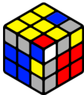
(R U R' U') (S)