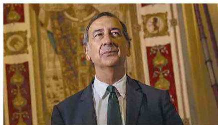
Il sindaco di Milano Beppe Sala

I drammatici fatti di Capodanno non sono un episodio isolato, si ha l'impressione di una città sempre più simile ad una capitale sudamericana. Si va diffondendo una criminalità di strada che rende insicura la vita dei cittadini e che sta a dimostrare l'assenza di un controllo del territorio. Le colpe sono molteplici. Innanzitutto una immigrazione mal gestita, che non ha consentito serie politiche di integrazione. Ci sono tuttavia anche precise responsabilità sulla gestione dell'ordine pubblico, sia a livello centrale sia a