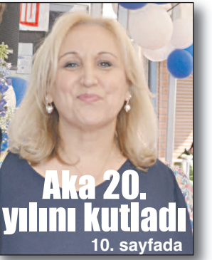
Aka 20. yılını kutladı 10. sayfada