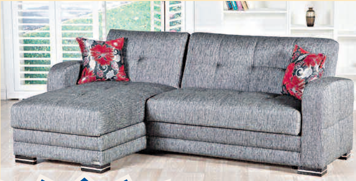
Kubo Uzanmalı Köşe Koltuk