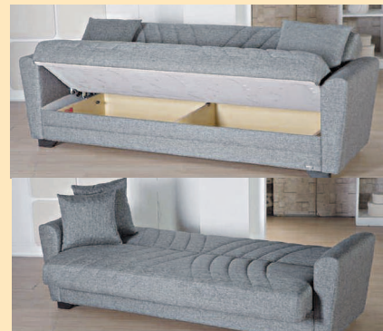
Dynamic 3 lü koltuk