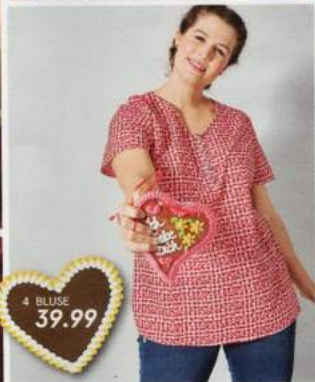
4 BLUSE 39.99