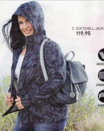
3 SOFTSHELL-JACKE 119.95