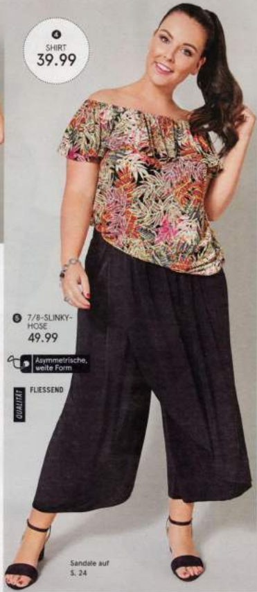
5 7/8-SLINKY-HOSE 49.99