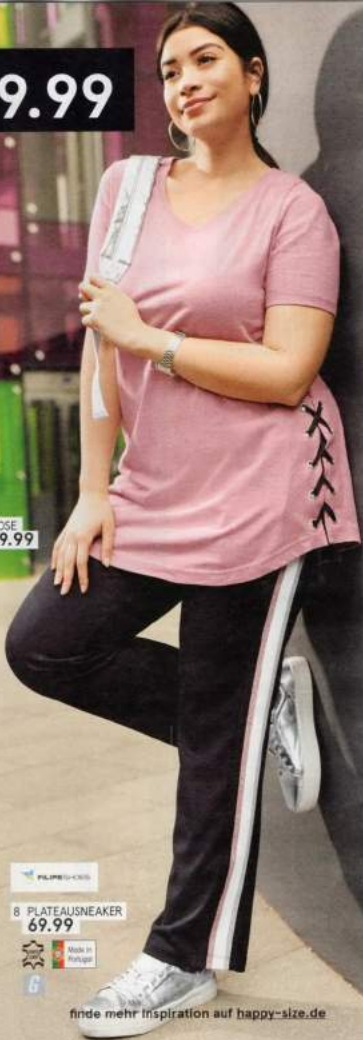
7 HOSE 39.99