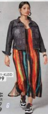
2 JERSEY-KLEID 39.99