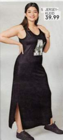
5 JERSEY- KLEID 39.99