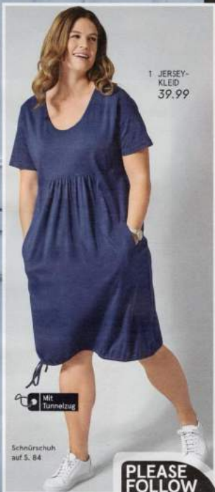
1 JERSEY- KLEID 39.99