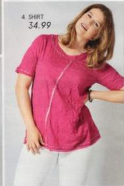
4 SHIRT 34,99