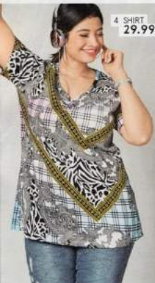
4 SHIRT 29.99