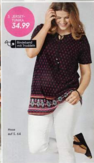
3 JERSEY-TUNIKA 34,99