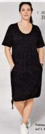
1 JERSEY-KLEID 39.99