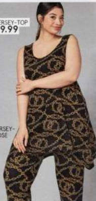
5 JERSEY- HOSE