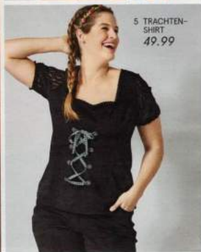
5 TRACHTEN- SHIRT 49.99