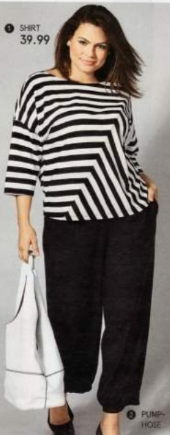
1 SHIRT 39.99