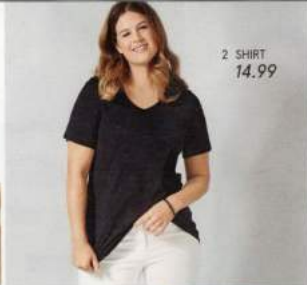
2 SHIRT 14,99