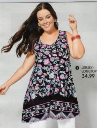
1 JERSEY-LONGTOP 34.99