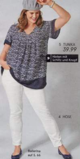
5 TUNIKA 39.99