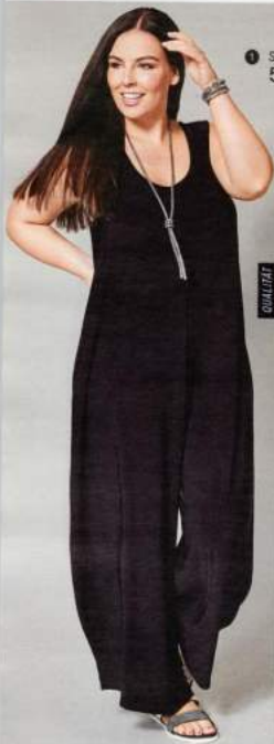
1 SLINKY-JUMPSUIT 59.99

QUALITÄT FLIESENDE QUALITÄT SCHLICHT OHNE TEILUNGSNÄHTE