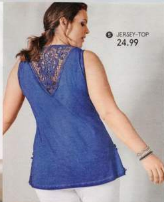
5 JERSEY-TOP 24,99