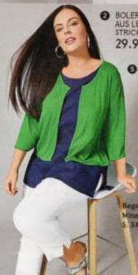
Begleithose Mina auf S. 34