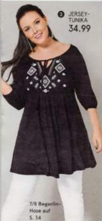
3 JERSEY-TUNIKA 34.99