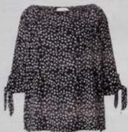
5 TUNIKA 39.99