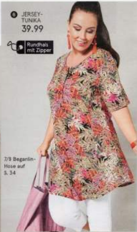
6 JERSEY-TUNIKA 39.99