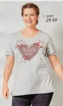
1 SHIRT 29.99