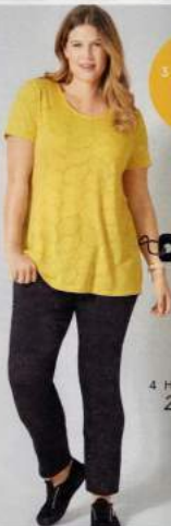
3 SHIRT 29.99