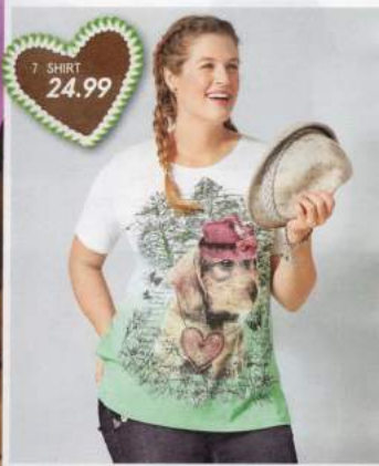
7 SHIRT 24.99