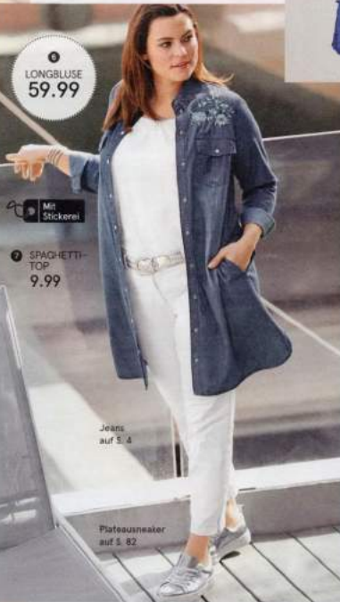
Jeans auf S. 4