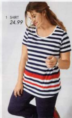
1 SHIRT 24.99