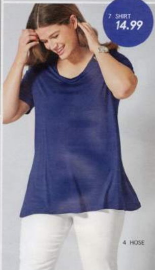
7 SHIRT 14.99