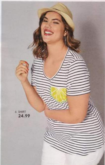
6 SHIRT 24.99