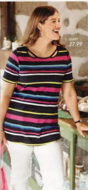
1 SHIRT 27,99