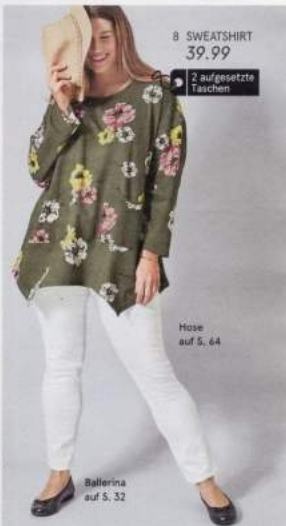
8 SWEATSHIRT 39.99