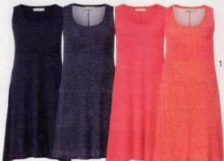
1 JERSEY- KLEID

marine marine getupft koralle koralle getupft