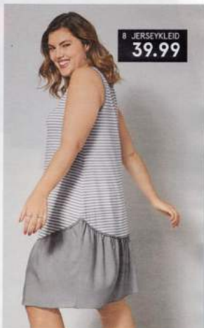
8 JERSEYKLEID 39.99