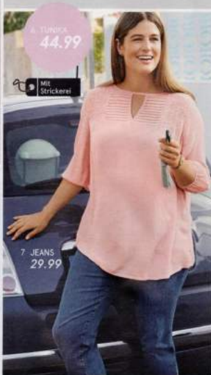
4 TUNIKA 44.99