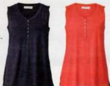
2 JERSEY- TOP

mehr Janet & Joyce entdecken auf happy-size.de