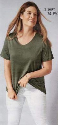
3 SHIRT 14.99