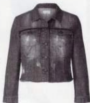
1 JEANSJACKE 49.99