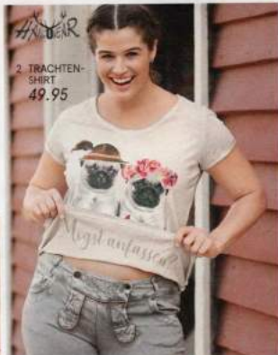
2 TRACHTEN-SHIRT 49.95