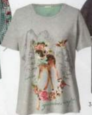
2 SHIRT 24.99