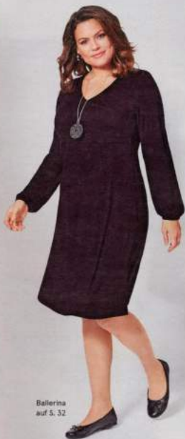
Ballerina auf S. 32

Leicht ausgestellte, locker fallende Rockteile umspielen Hüfte und Oberschenkel. Proportionen werden gekonnt ausbalanciert.