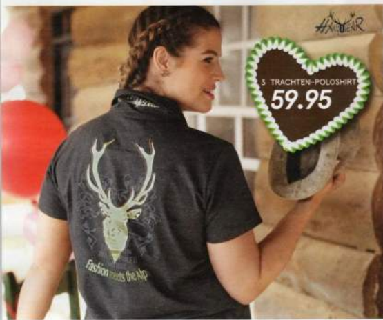
3 TRACHTEN-POLOSHIRT 59.95