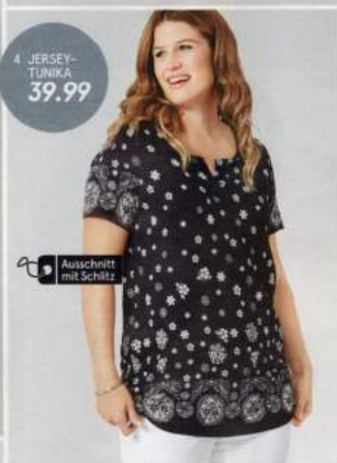
4 JERSEY-TUNIKA 39.99