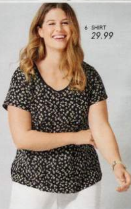
6 SHIRT 29.99