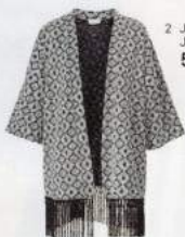
2 JERSEY- JACKE 59.99