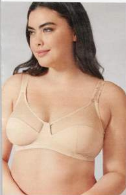
7 BÜGEL-BH ab 29.99