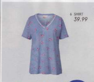
6 SHIRT 39.99