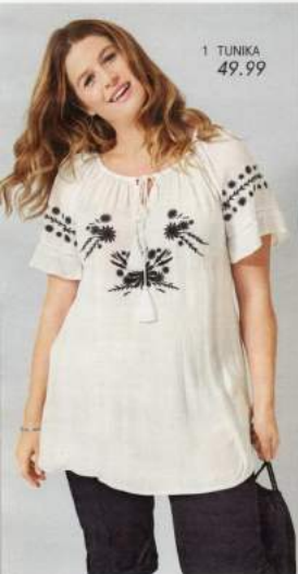
1 TUNIKA 49.99