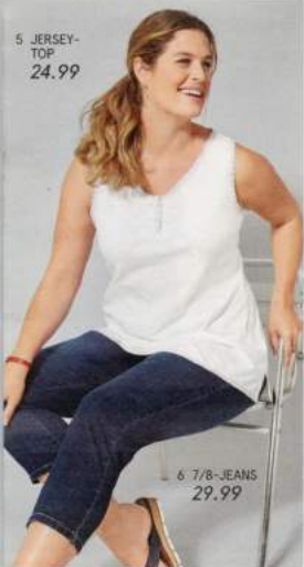
6 7/8-JEANS 29.99