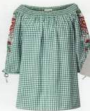
1 BLUSE 49.99