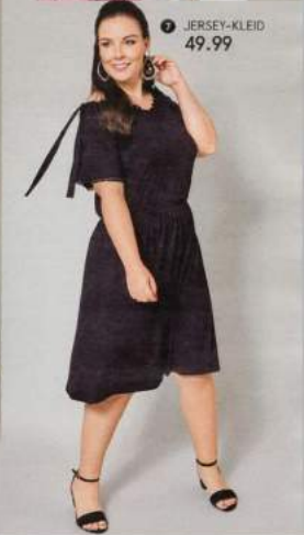
7 JERSEY-KLEID 49.99