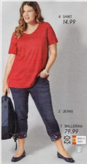
4 SHIRT 14.99