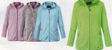
1 STRICK-FLEECE-JACKE 69.99