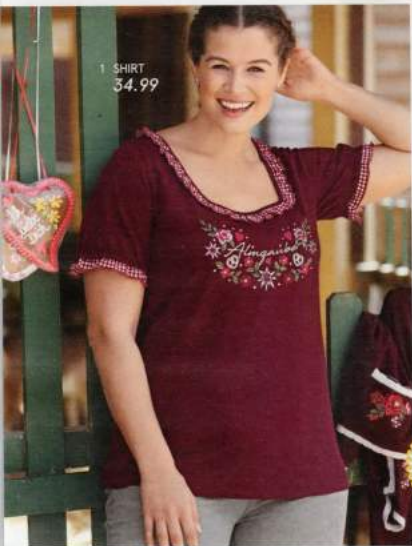
1 SHIRT 34.99