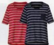
9 SHIRT 29.99