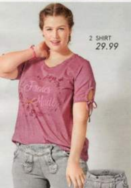
2 SHIRT 29.99