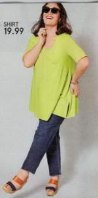
1 SHIRT 19.99

1 SHIRT A-Shape. 1/2 Ärmel. Seitenschlitze. 95% Viskose, 5% Elasthan. Länge: ca. 75 cm. 44 070/950 marineblau, 02 089/950 neongelb, 02 848/850 orange, 93 625/050 schwarz. Gr.: 42 - 58 19.99