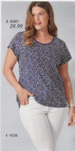
8 SHIRT 29.99