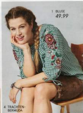
1 BLUSE 49.99