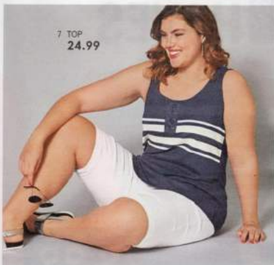
7 TOP 24.99