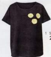
1 SHIRT 29.99