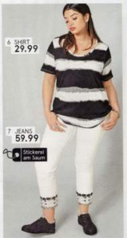
6 SHIRT 29.99