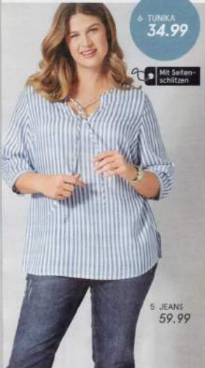
5 JEANS 59.99