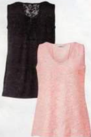
1 SPITZEN- LONGTOP 39.99