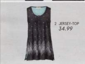
2 JERSEY-TOP 34.99