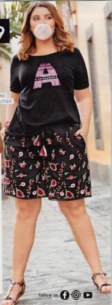
4 SHORTS 49.99

SCHWARZ, WEISS UND SILBER KOMBINIERT MIT GLITZER IST DER KNALLER! HAPPY-SIZE.DE