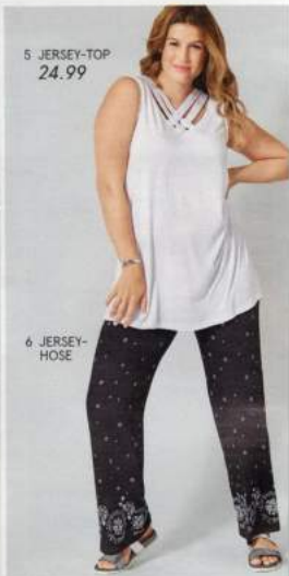
5 JERSEY-TOP 24.99