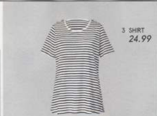
3 SHIRT 24.99