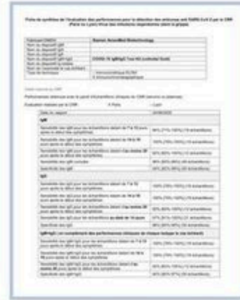
Evaluation in France